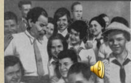
М. Горький о писателях — авторами книги «Вам курьезно». Фотосъемка.