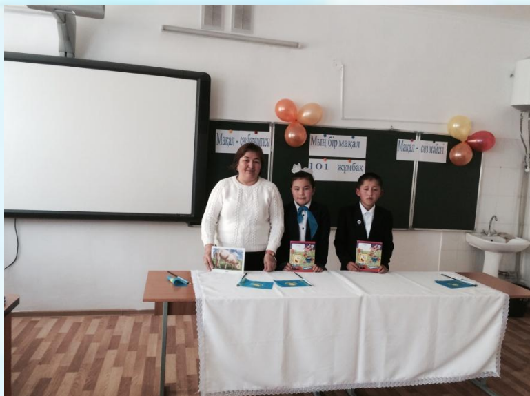
Көрермендер ойынының жеңімпаздары