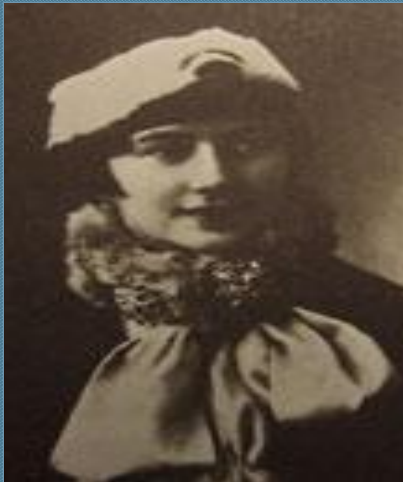
Любовь Евгеньевна Белозерская (1898—1987) Вторая жена Булгакова. (1925 год)