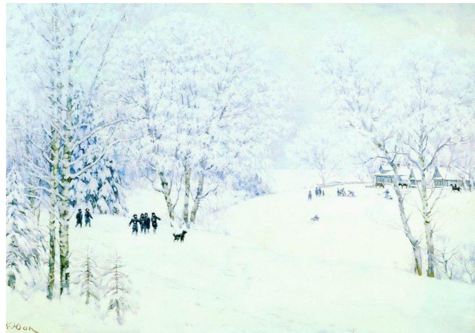
К.Ф.Юон «Русская зима.Лигачёво»