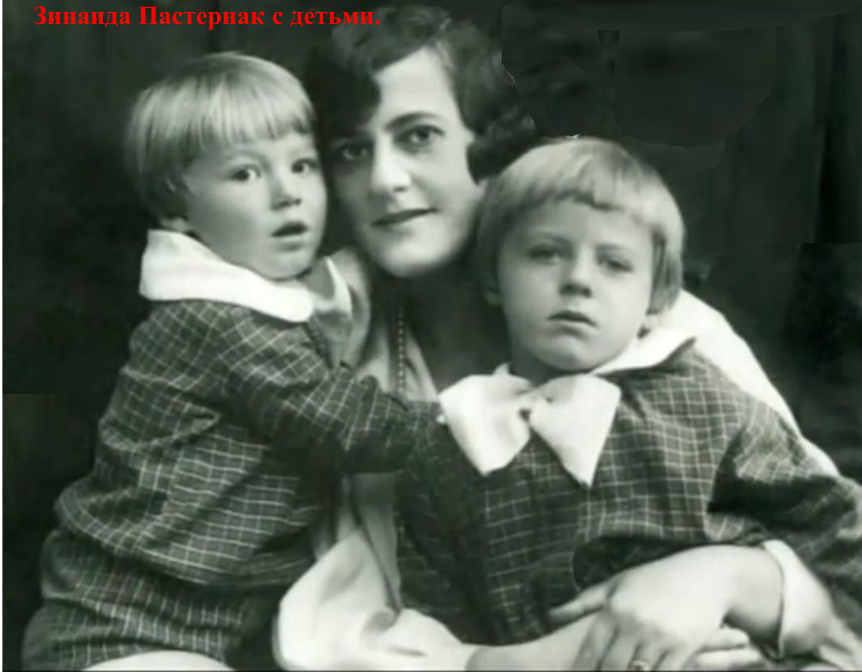
Зинаида Пастернак с детьми.