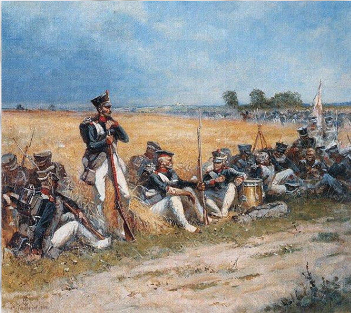
А.Кондратьев «В день Бородинского сражения»