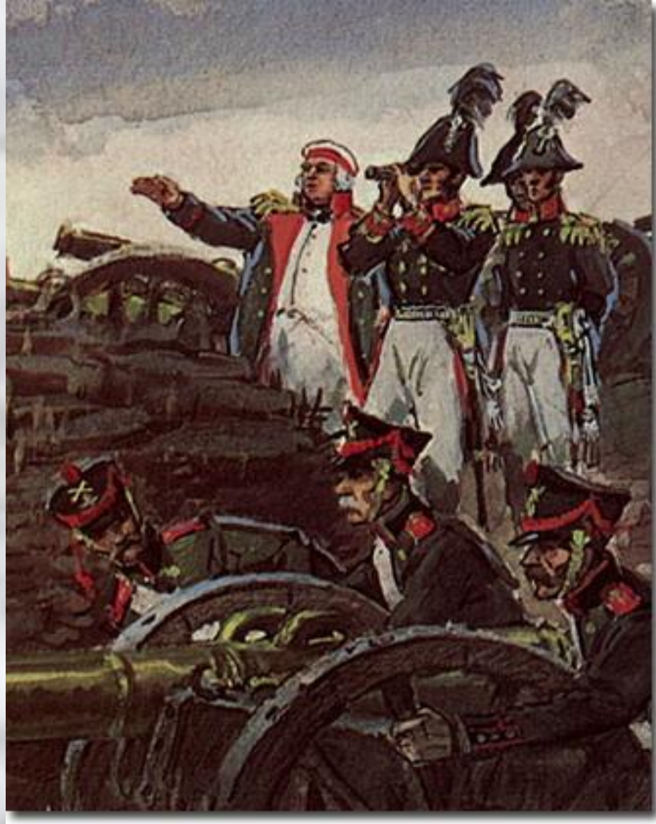
В.Шевченко «Кутузов осматривает позицию при Бородине»