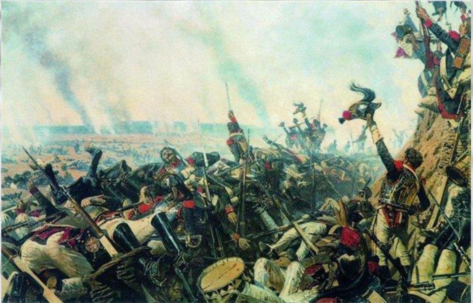
В.Верещагин «Конец Бородинского сражения»