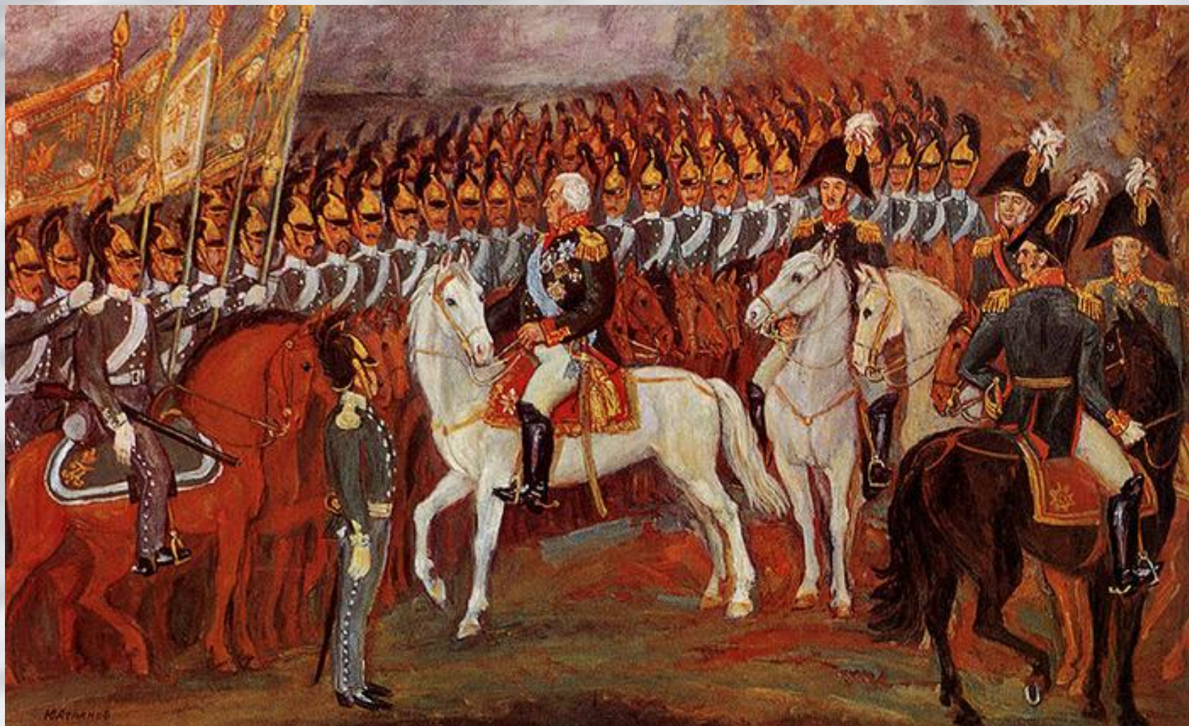
Ю.Атлантов «Обращение Кутузова к войскам накануне Бородинской битвы»