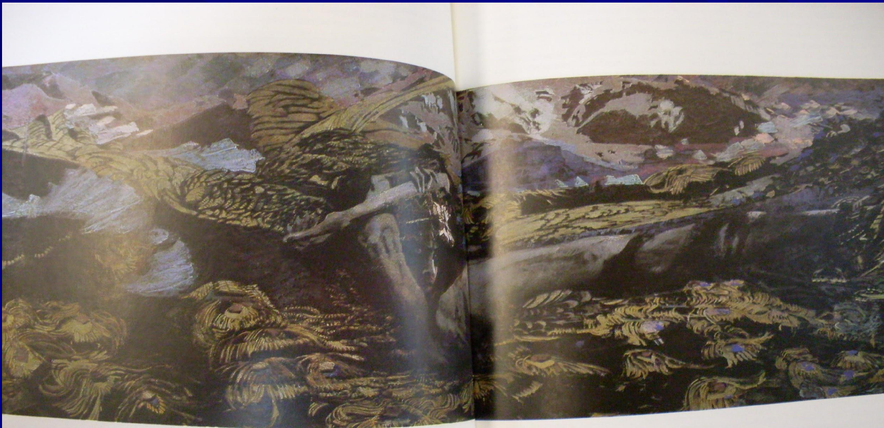
ДЕМОН ПОВЕРЖЕННЫЙ. 1902 г.