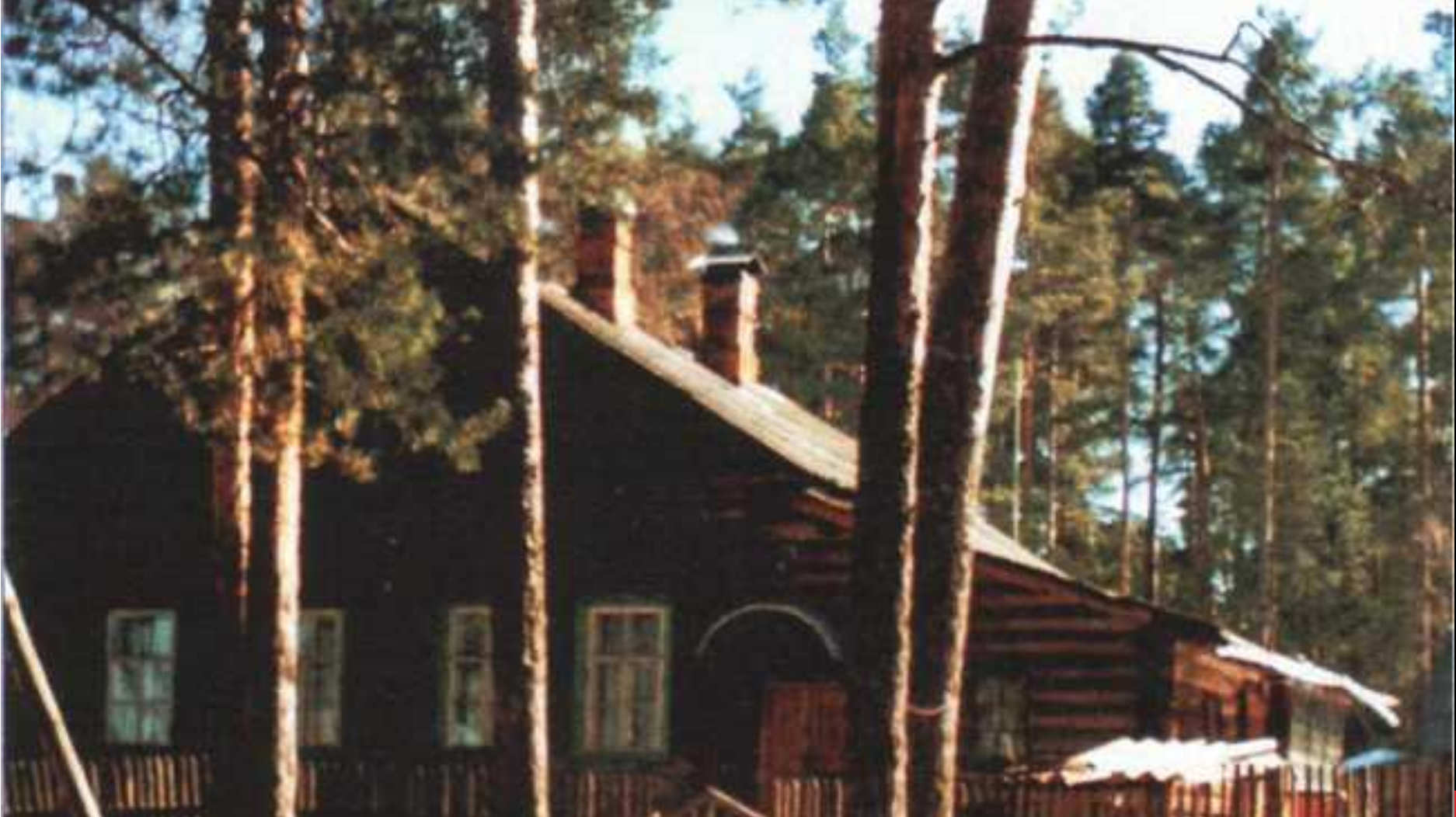
Дом в Усолъе, в котором в годы войны жил М.М.Пришвин