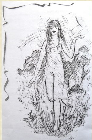
«Летние акварели »