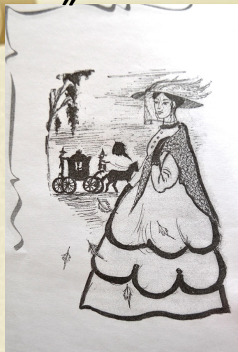
«Девушка из прошлого»