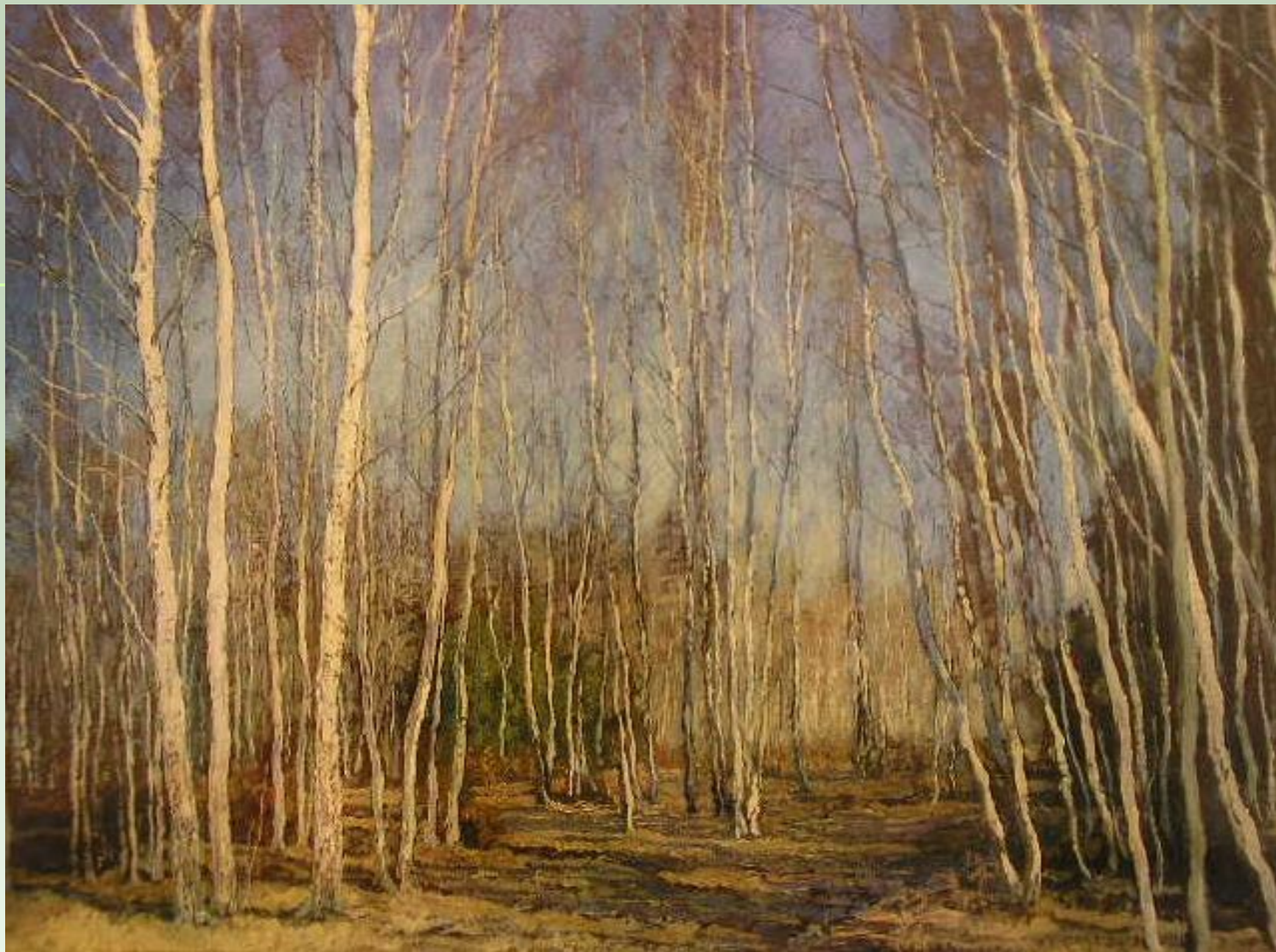
Бакшеев Василий Николаевич «Голубая весна»