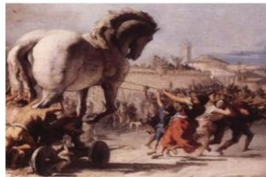
Джованни Доменико Тьеполо. Шествие троянского коня в Трои.

- коварные дары, несущие с собой гибель для тех, кто их получает. Возникло из греческих сказаний о Троянской войне. Данайцы после длительной и безуспешной осады Трои прибегли к хитрости: они соорудили огромного деревянного коня, оставили его у стен Трои, а сами сделали вид, что уплывают от берега Трояды. Зная о хитрости данайцев жрец Лаокоон, увидев этого коня, воскликнул: «Что бы это ни было, я боюсь данайцев, даже дары приносящих!» Но троянцы, не слушая предостережений Лаокоона и пророчицы Кассандры, втащили коня в город. Ночью данайцы, спрятавшиеся внутри коня, вышли, перебили стражу, открыли городские ворота, пустили вернувшихся на кораблях товарищей и таким образом овладели Троей.