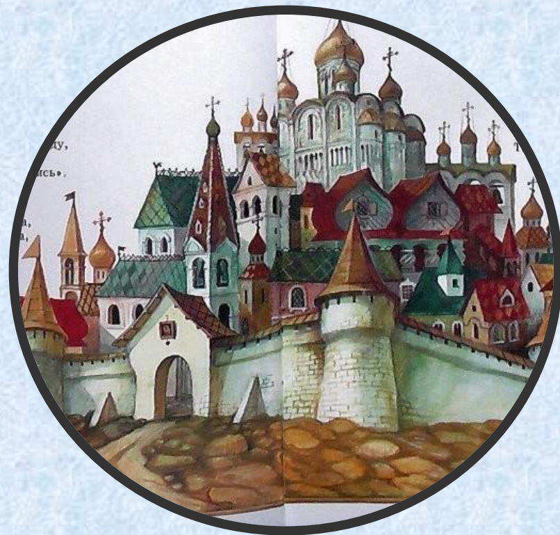
МЕНЬШЕ , чем Дворец царевны