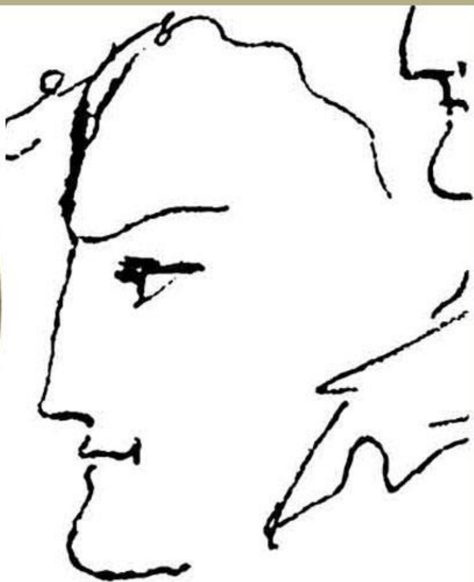
Е. П. Бакунина рис. А.С. Пушкина