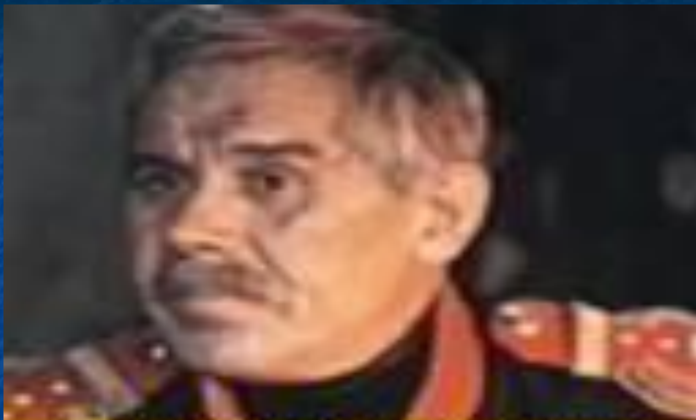
МАКСИМ МАКСИМЫЧ (А. Чернов)