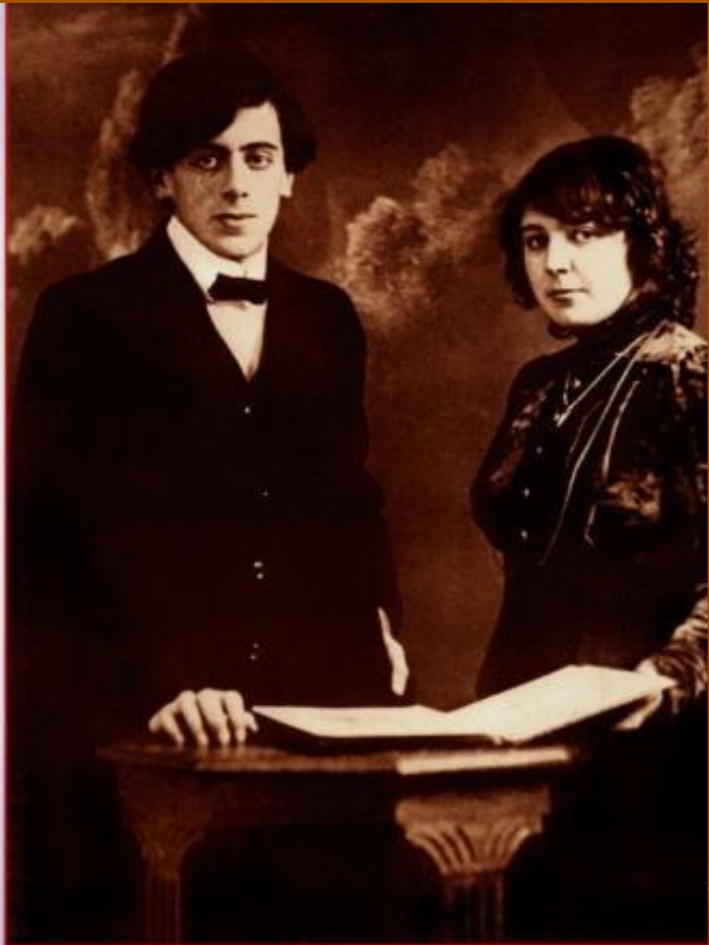
К статье на стр. 17

Я с вызовом ношу его кольцо! - Да, в Вечности — жена, не на бумаге. —