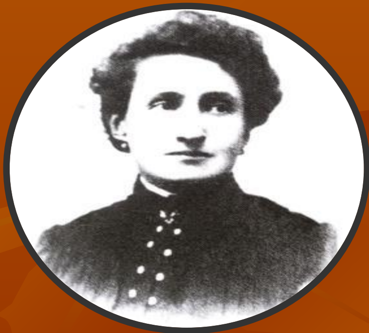
М.А. Мейн – мать М. Цветаевой

Мать Мария Александровна Мейн - талантливая пианистка, ученица Рубинштейна.