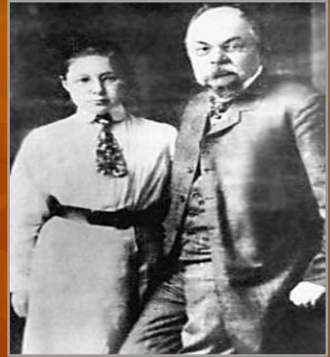
М. Цветаева с отцом

Отец Иван Владимирович Цветаев - профессор Московского университета, искусствовед и филолог, впоследствии основатель Музея изящных искусств, ныне Музей изобразительных искусств им. А.С. Пушкина.