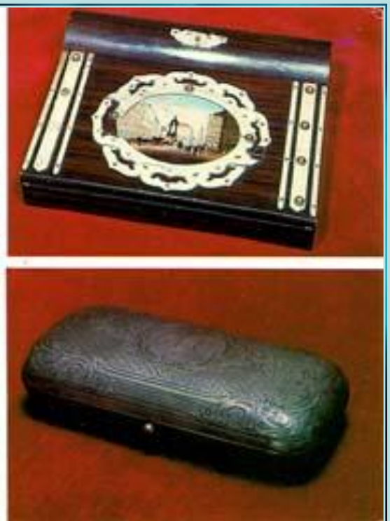
Личные вещи драматурга: шкатулка-секретер и серебряный портсигар

Драматическая поэзия ближе к народу, чем все другие отрасли литературы. Все другие произведения пишутся для образованных людей, а драмы и комедии - для всего народа.