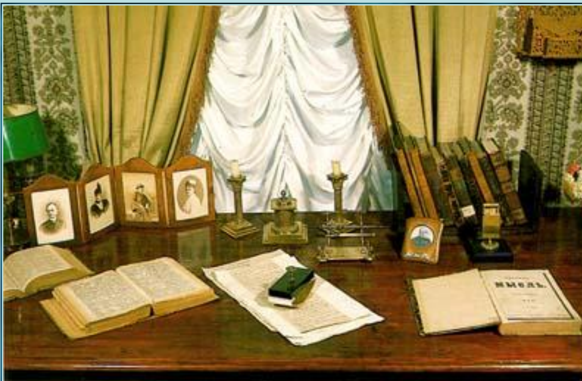
Письменный стол А.Н. Островского.