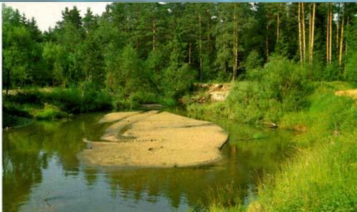
Река Куекша. Место, где была старая мельница

Жалко, что ты не пейзажист, а то побывал бы у меня в деревне: подобного русского пейзажа едва ли где-то найдёшь.