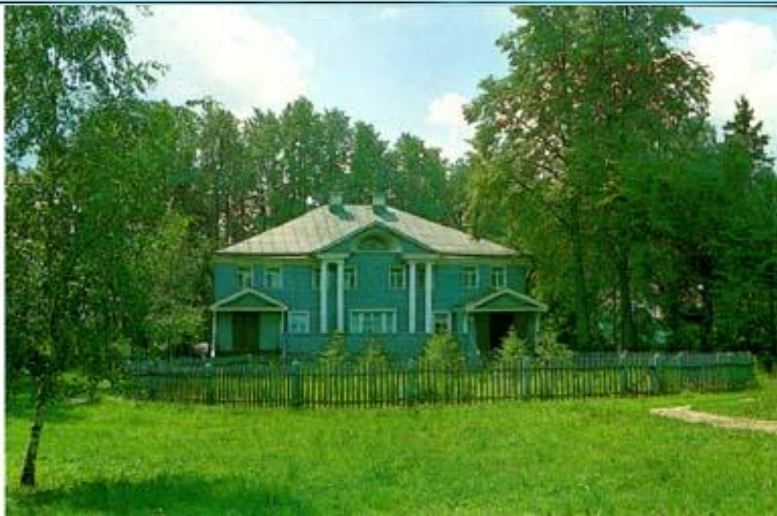
Мемориальный дом-музей А.Н. Островского. Северный фасад

Господский дом, в котором жил Александр Николаевич, находится на горе. Он деревянный, окрашен серой краской, с четырьмя колоннами, двумя крыльцами.