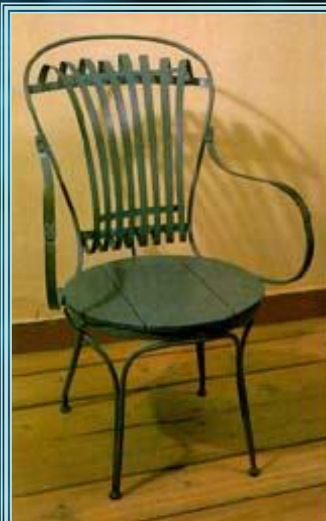
Рыболовное кресло А. Н. Островского