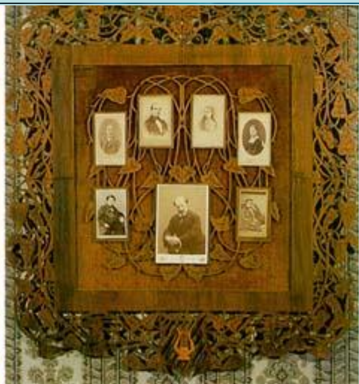
Резная рамка, сделанная А.Н. Островским, с фотографиями его друзей-актеров

Пьесы я задумал две, не знаю, за которую прежде возьмусь, но во всяком случае, в деревне одну какую-нибудь кончу.