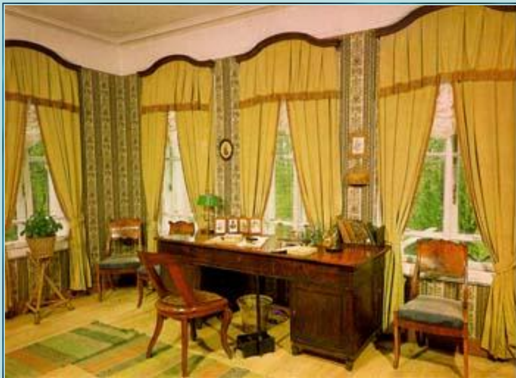
Кабинет А.Н. Островского