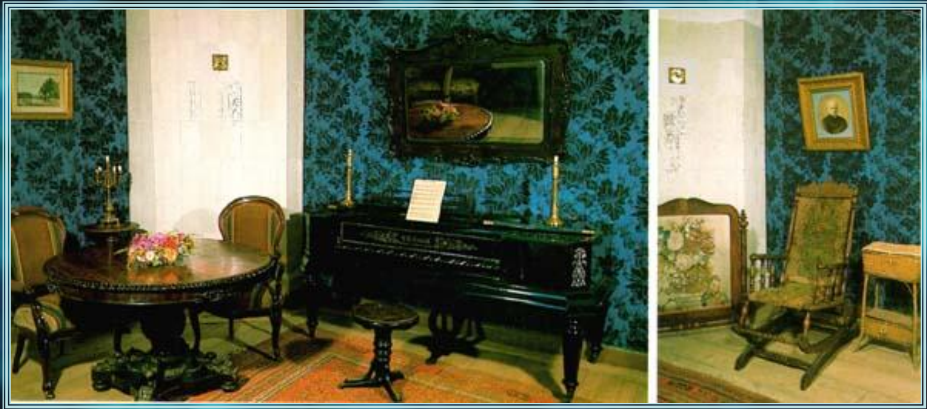
Гостиная. Старинное фортепьяно отца писателя.