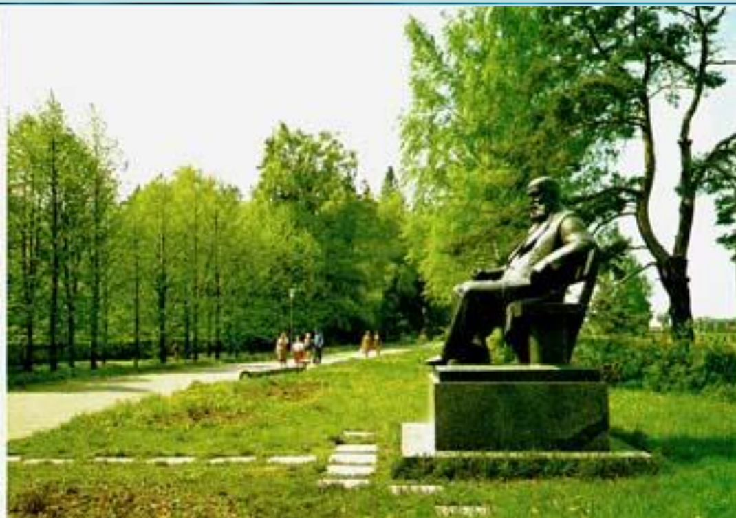
Главная (еловая) усадебная аллея