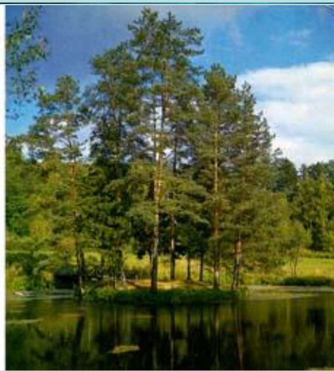
Вид на южную террасу и парк