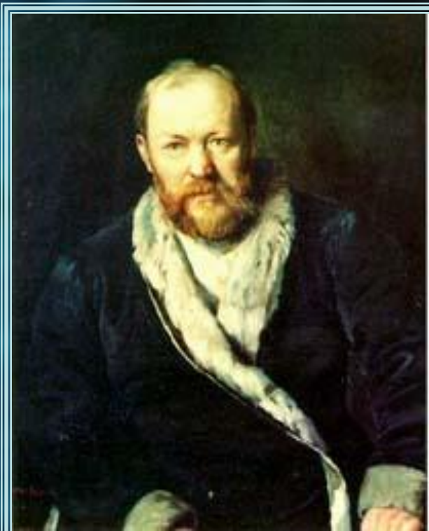
А.Н. Островский Художник В. Перов