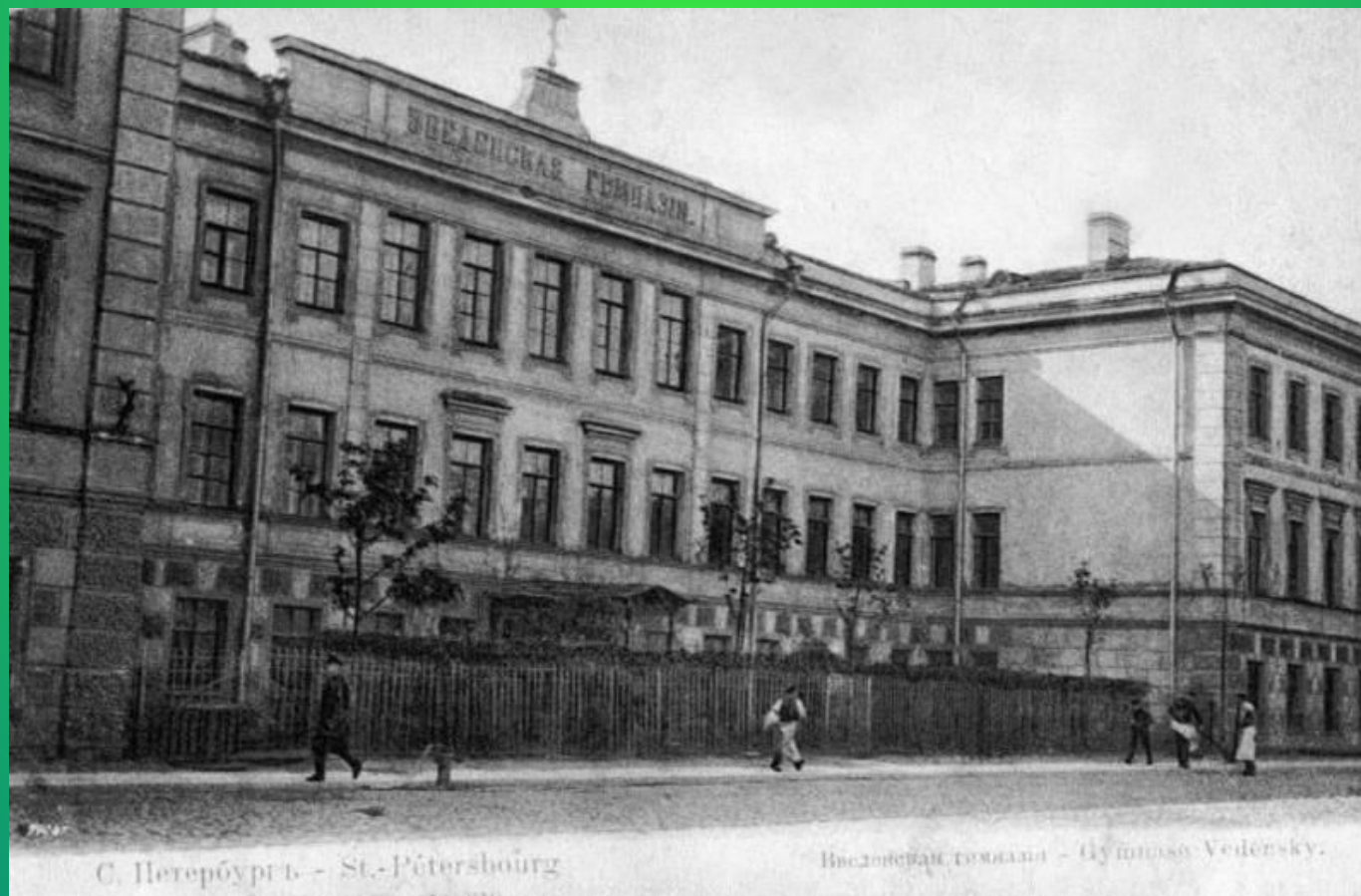
С. Петербургъ - St.-Petersbourg

Учился Блок в петербургской гимназии. В старших классах увлекался театром, любил декламировать стихи, ставил любительские спектакли, мечтал сделаться актером, но писать не переставал.