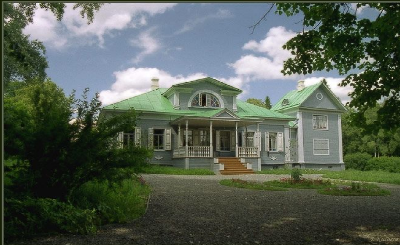
Шахматово, Усадьба А. Блока...

Александр Блок родился в Петербурге 16 ноября 1880 года. В Петербурге его семья проводила зиму, а летом уезжала в небольшую усадьбу Шахматово, под Москвой. С этим местом у Блока связано много радостных детских и юношеских воспоминаний.