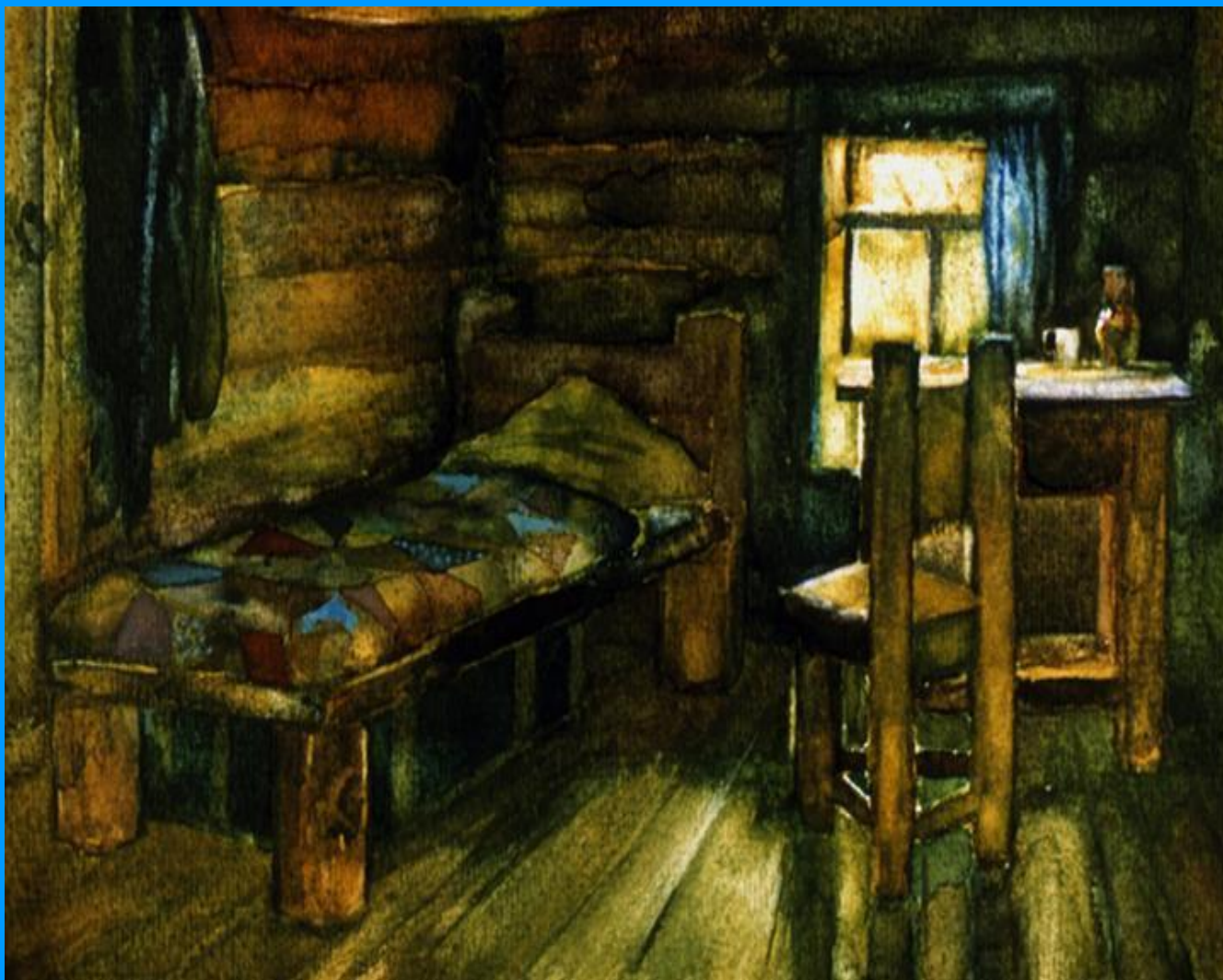
А.И.Кулешов «Каморка Герасима»