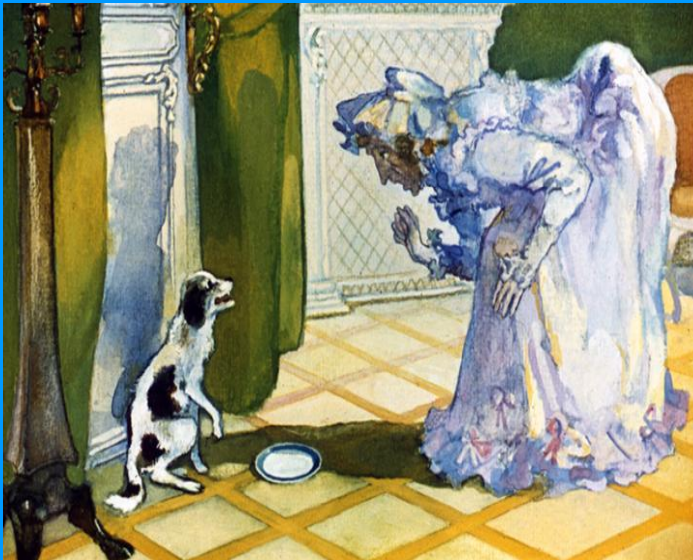
А.И.Кулешов «Барыня и Муму»