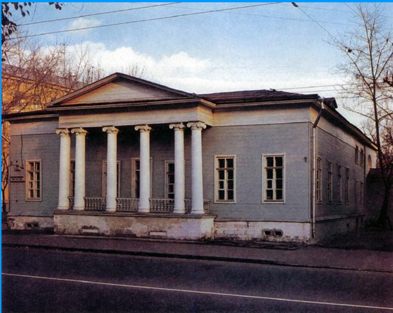
Дом на Остоженке (д.37)