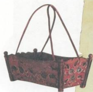
Детская люлька (лялька)

Баю-баю, баю-бай, Ты, собачка, не лай, Белолапа, не скули, Мою детку не буди.