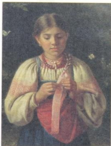
Николай Рачков Портрет девочки

Алёнка-малёнка Шуфра-быстра: Воды наносила, Сарафан дошила, Носок довязала, Ягод насобирала. Везде поспела — В охотку ей дело.