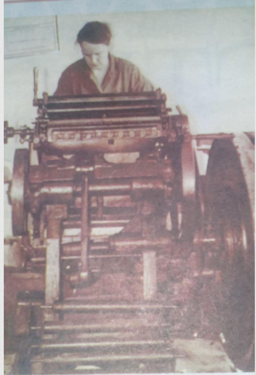
На такой «американке» печаталась газета в 1930 году.

До октября 1971 года редакция газеты и типография располагались на первом этаже Дома Советов, в его западной части, после чего они переместились в нынешнее здание, построенное на улице Правды. После известных августовских события 1991 года районная газета меняет свое название на «Лискинские известия», под