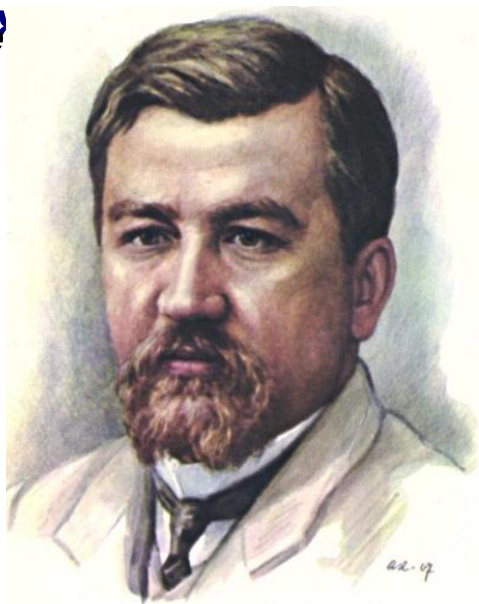
А. И. Куприн