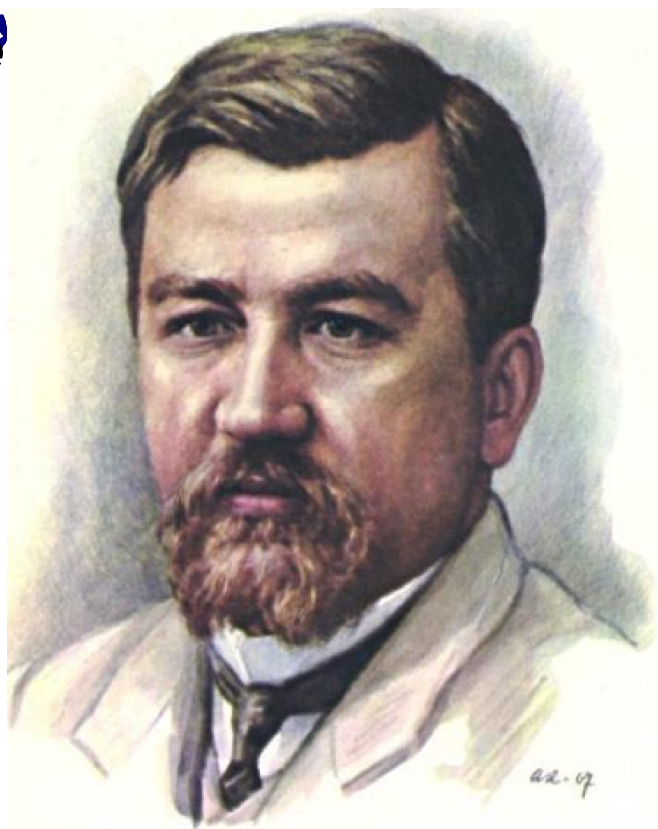
А. И. Куприн