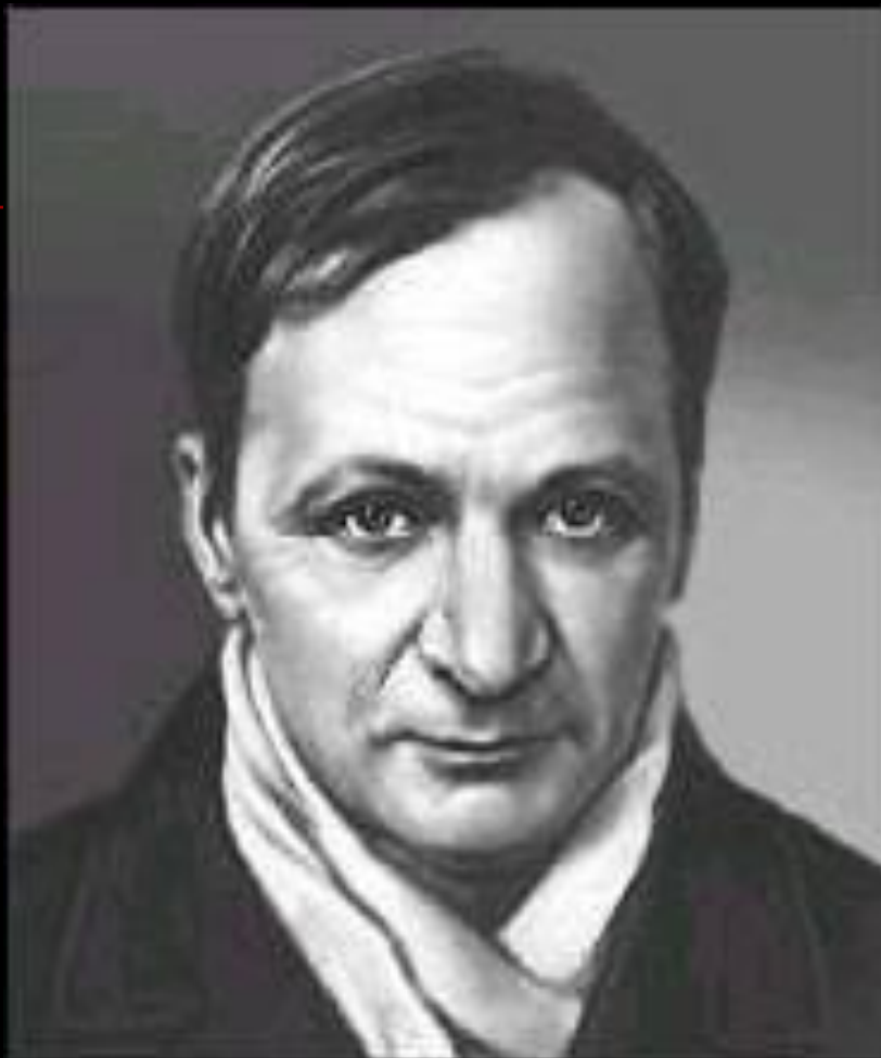
Андрей Платонович Платонов (Климентов А.П.) 1899 – 1951 г.г.