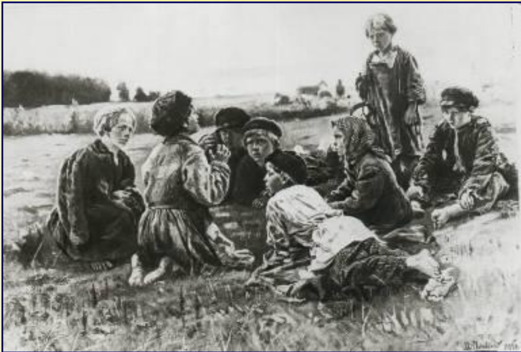
В. Е. Маковский «В ночном»