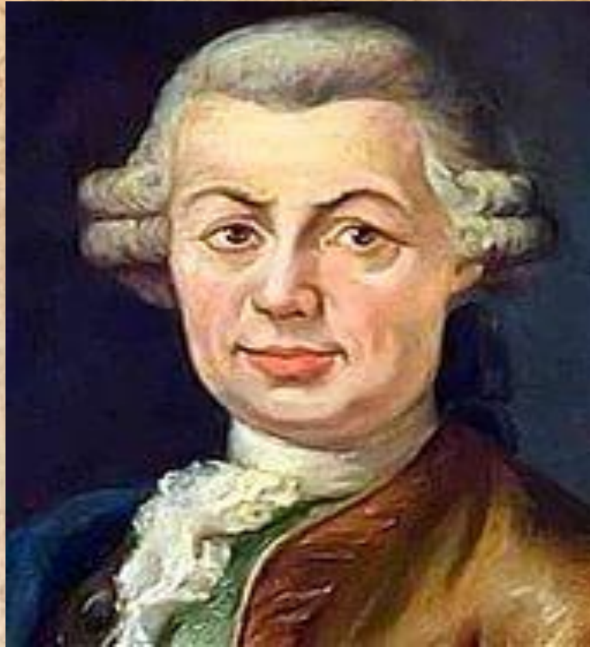
Карло Гоцци (1720- 1806)