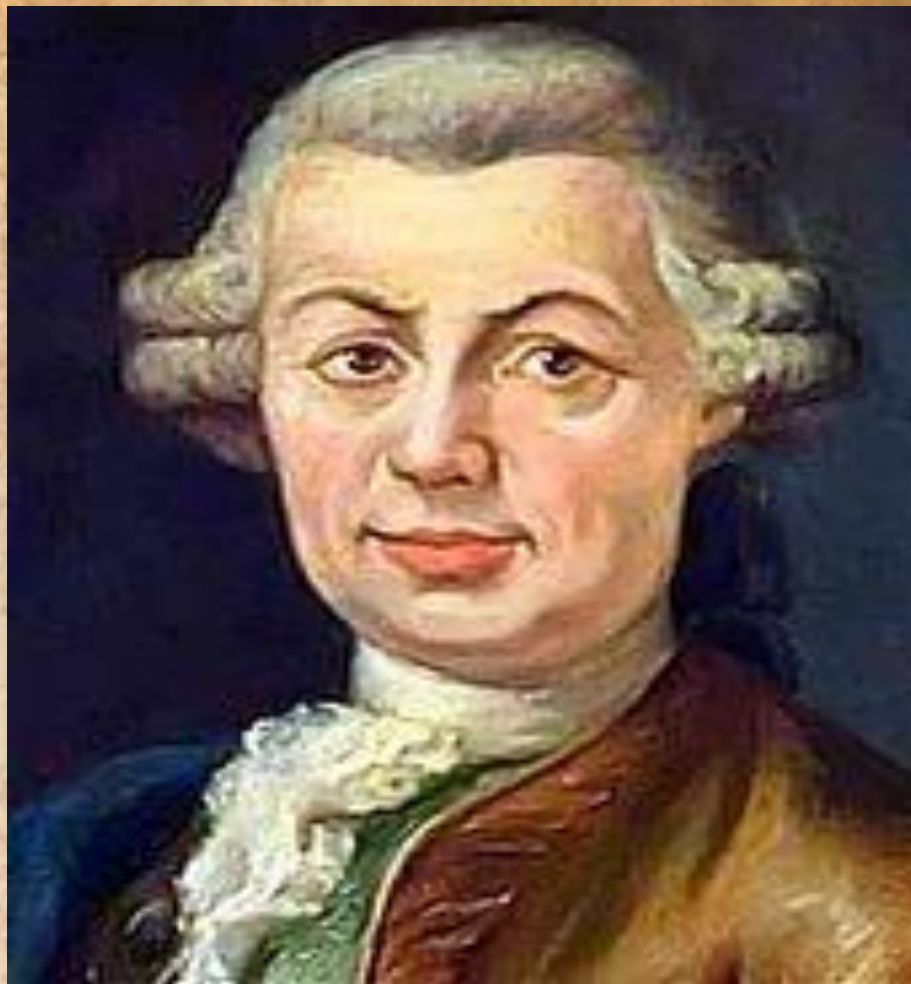
Карло Гоцци (1720- 1806)