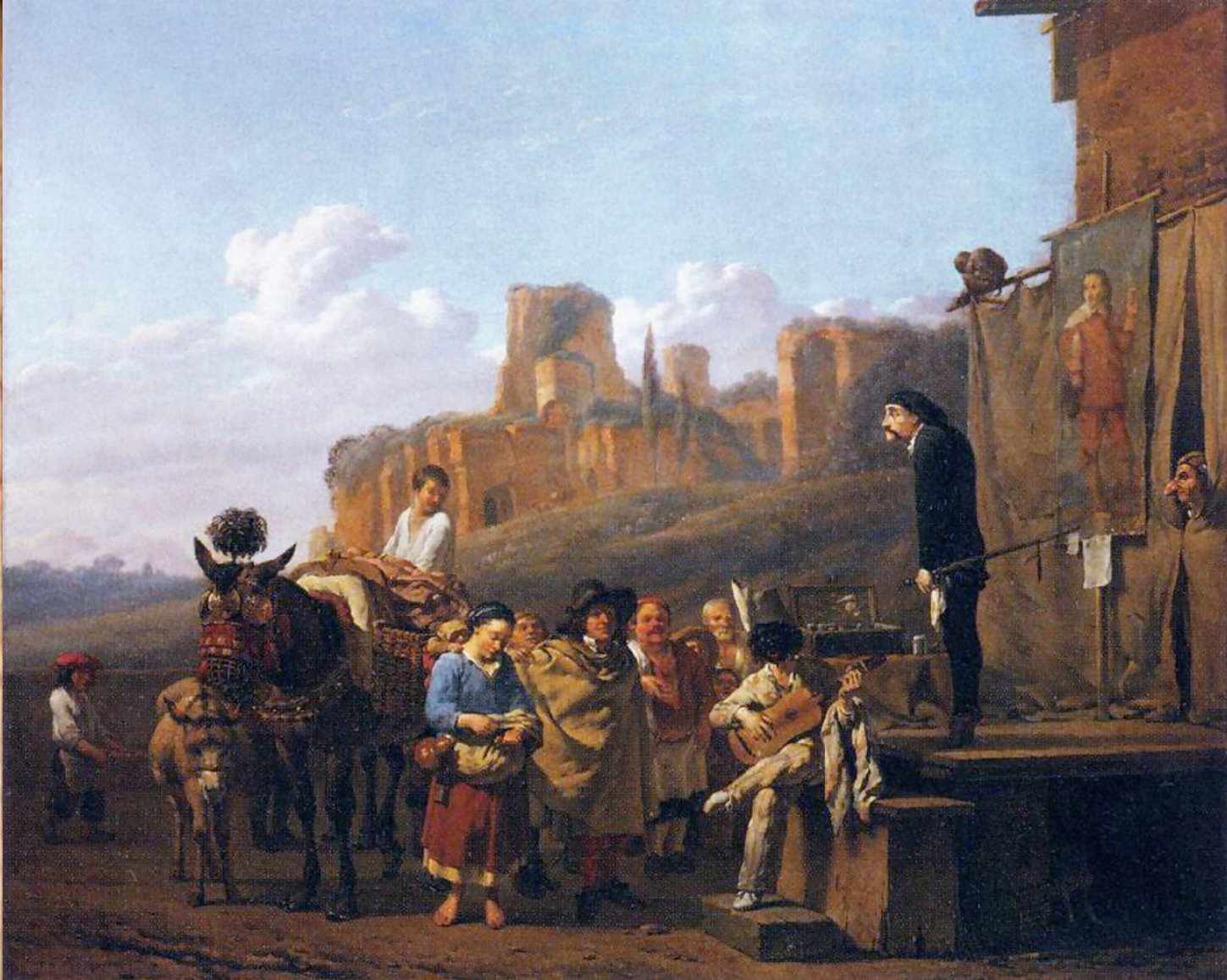
Представление комедии дель арте, Карел Дюжарден, 1657