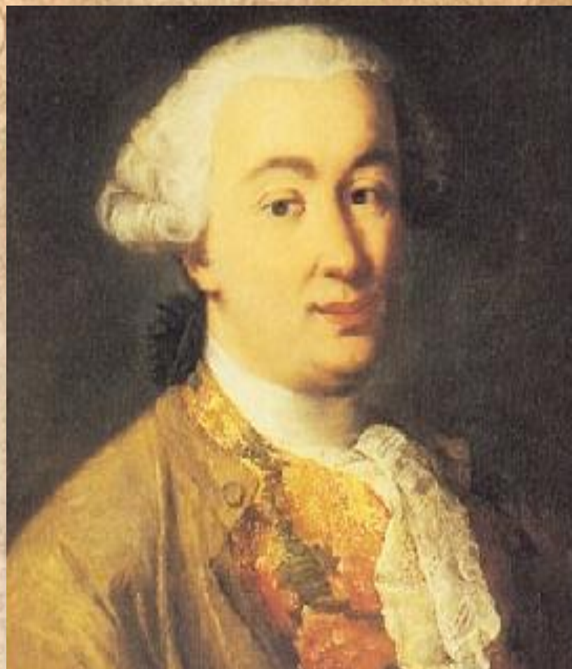
Карло Гольдони (1707 – 1793)