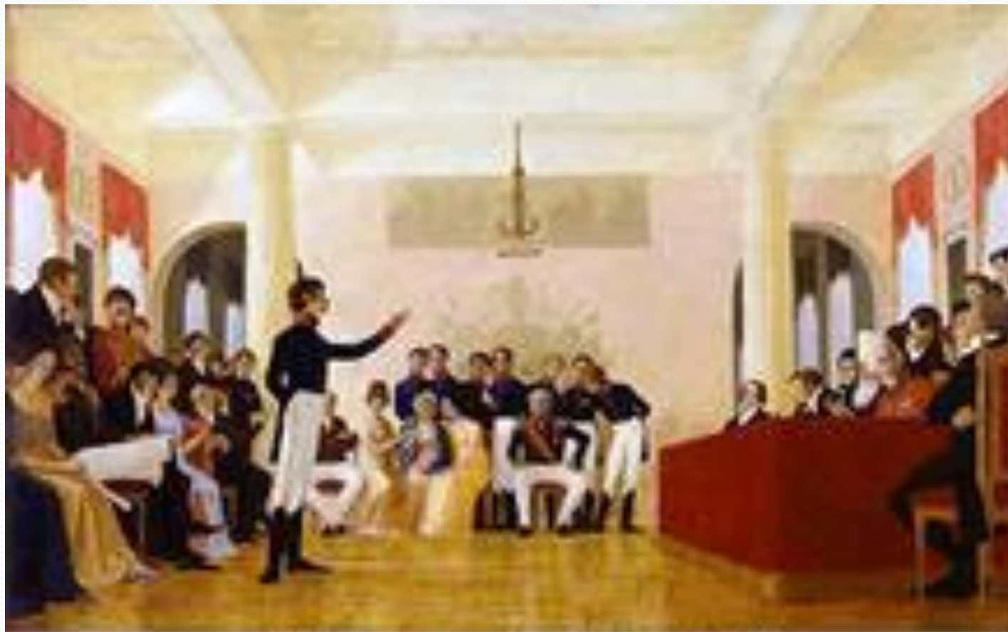
А.С.Пушкин на занятиях в Лицее. 1902-03 гг., к/м. 90х100