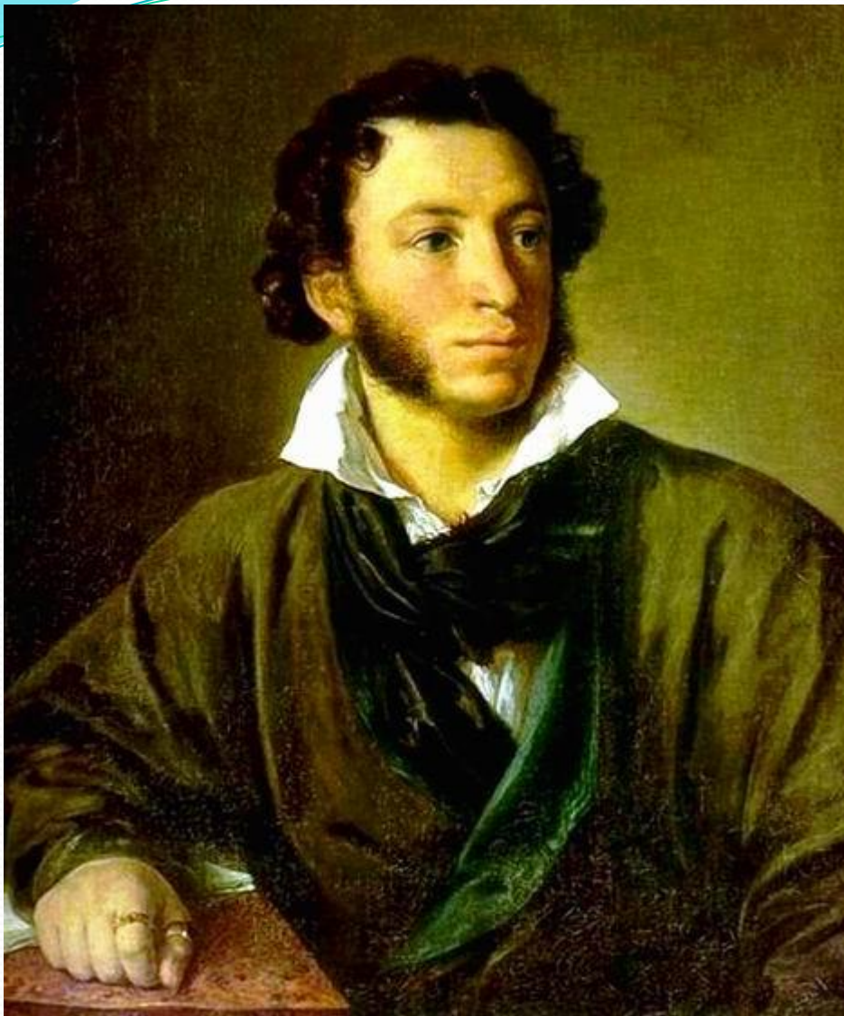
АЛЕКСАНДР СЕРГЕЕВИЧ ПУШКИН (1799-1837)