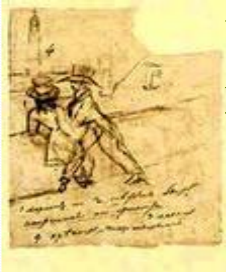
Рисунок А.С. Пушкина На рукописи романа «Евгений Онегин»