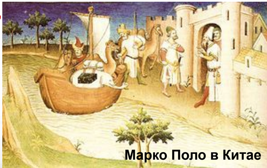
Марко Поло в Китае

В 1271 г. венецианский купец Марко Поло отправился в далекий и загадочный Китай. Путь в Китай лежал через многие страны. Вернувшись домой почти через четверть века, он не переставал восторгаться увиденными чудесами. В его речи то и дело слышалось: «Миллионе... миллионе». Слово «mille» («тысяча») было известно еще в Древнем Риме. Словечко «миллионе» , которым отважный путешественник называл тысячу тысяч , прочно пристало к Марко Поло. Современники прозвали его Марко Миллионе.