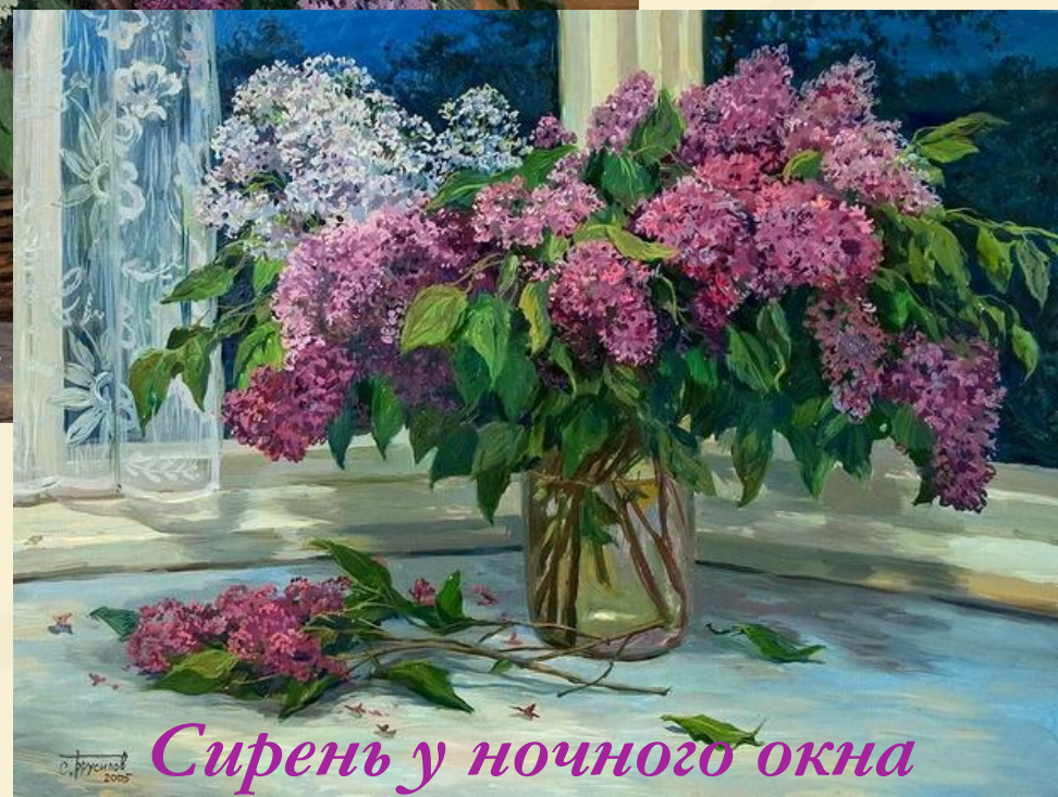
Сирень у ночного окна