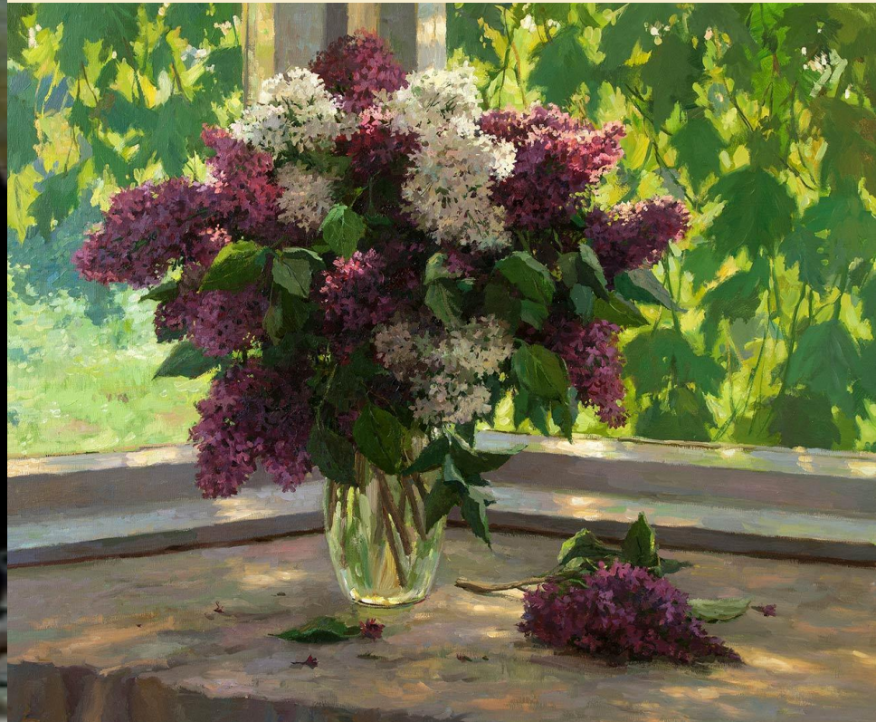
На солнечной веранде