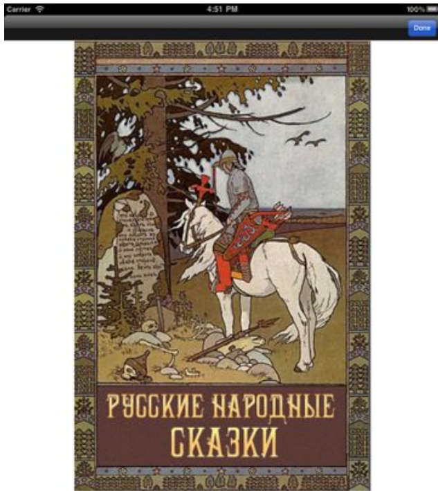
Русские народные сказки