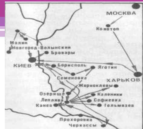
Карта боевых дорог А.Гайдара.

«Не хочу быть в запасе», - писал 22 июня 1941 года Аркадий Гайдар в заявлении отправить его на фронт.