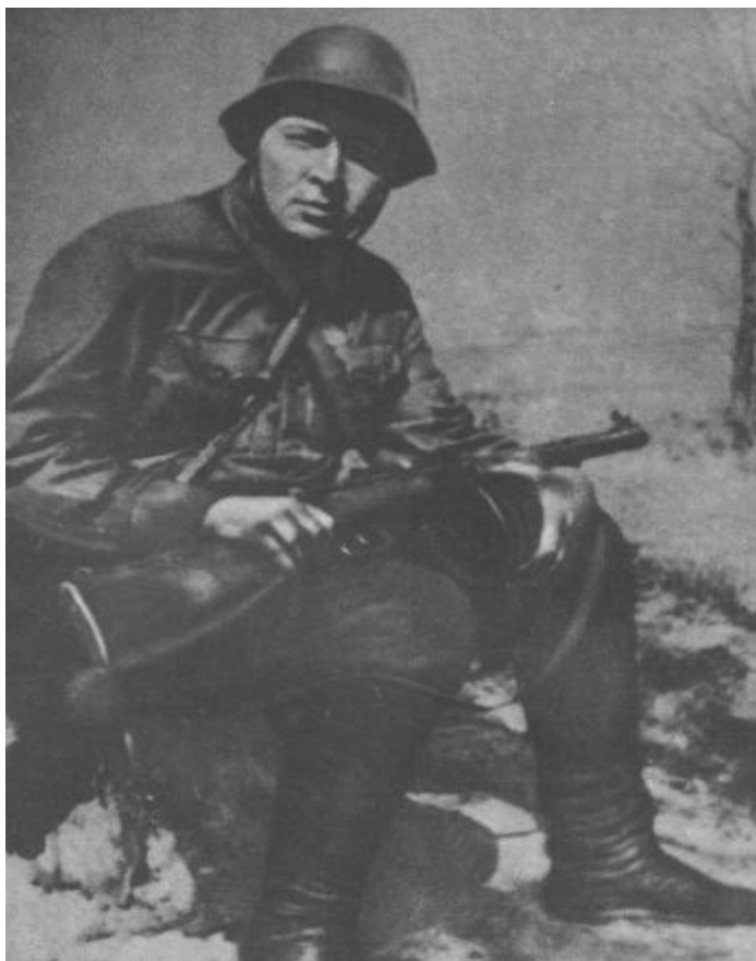
А.Гайдар на фронте. 1941 г.