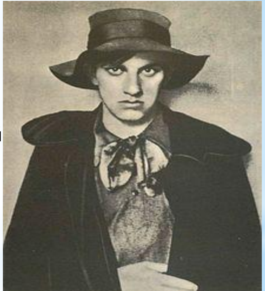
В. Маяковский 1910 г.

Несмотря на столь критичное отношение, Маяковский именно с этой тетрадки исчислял начало своего творчества.