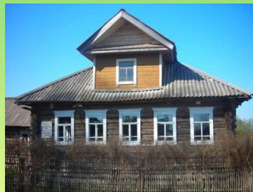
Дом-музей в деревне Блудново