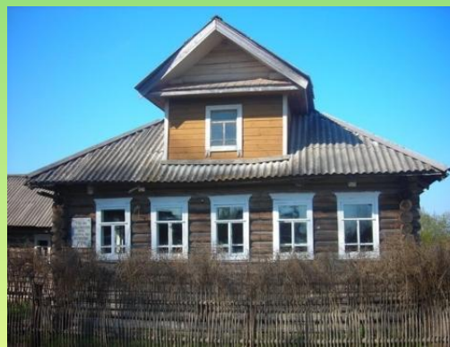
Дом-музей в деревне Блудново