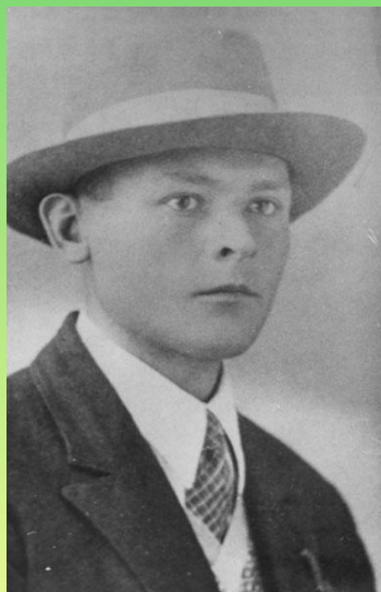
Александр Яшин в довоенные годы