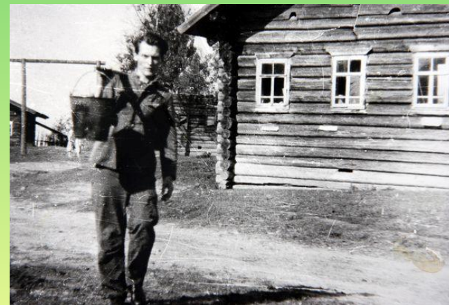
В родном Блуднове