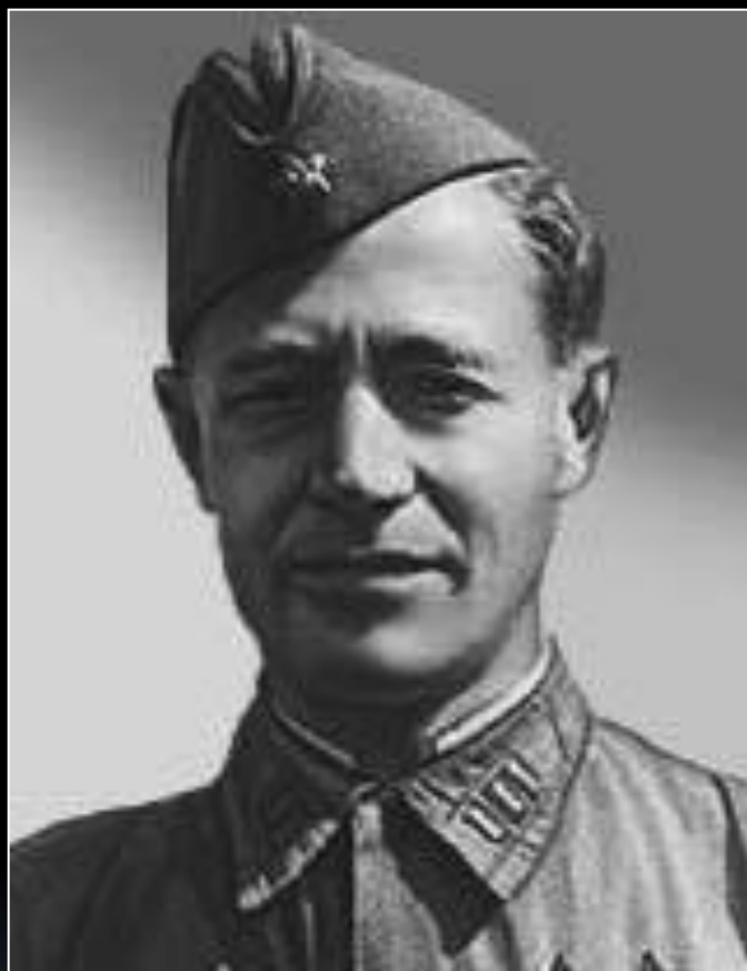
Военный корреспондент Алексей Сурков