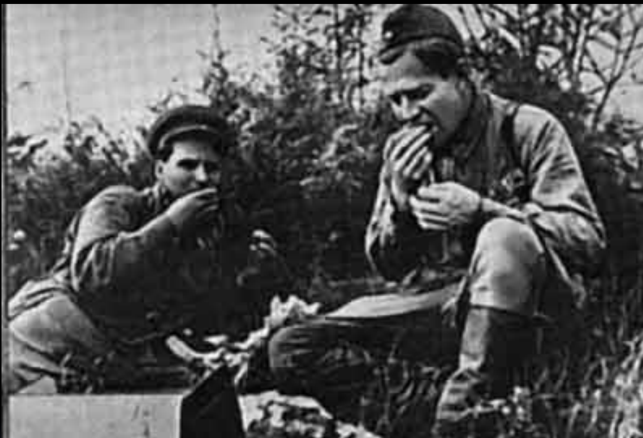
Константин Симонов и Алексей Сурков. Встреча на фронте.