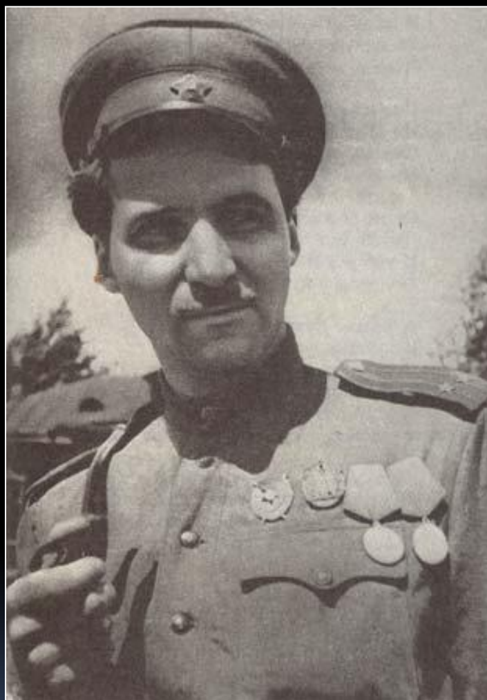
Военный корреспондент Константин Симонов