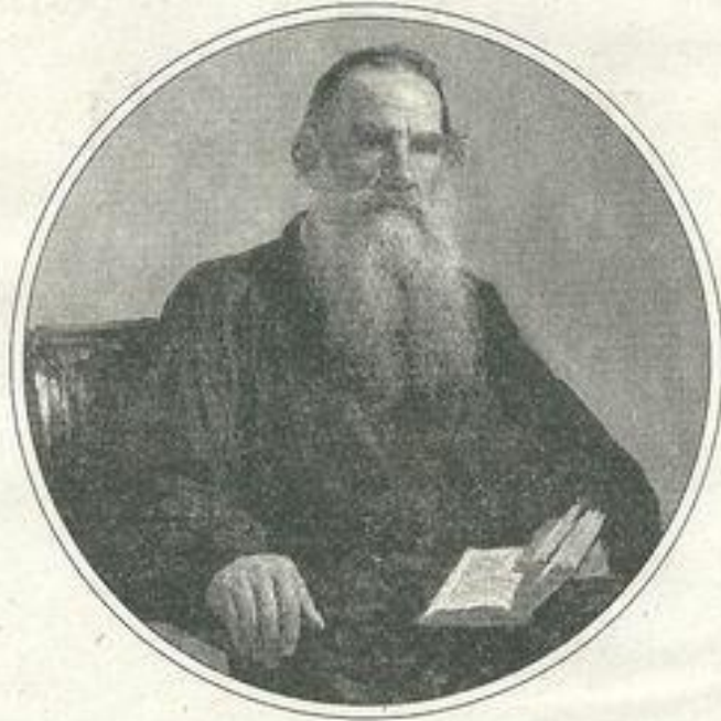
Лев Николаевич ТОЛСТОЙ

Смысл жизни Толстой видел в служении людям. Жить для себя одного нельзя. Это духовная смерть. Как можно меньше брать у людей и как можно больше давать людям. Эта мысль неоднократно повторяется в дневниках писателя. И самыми счастливыми годами в своей жизни Толстой считал те, когда он всего себя отдавал благу людей, работе в школе, помощи голодающим.