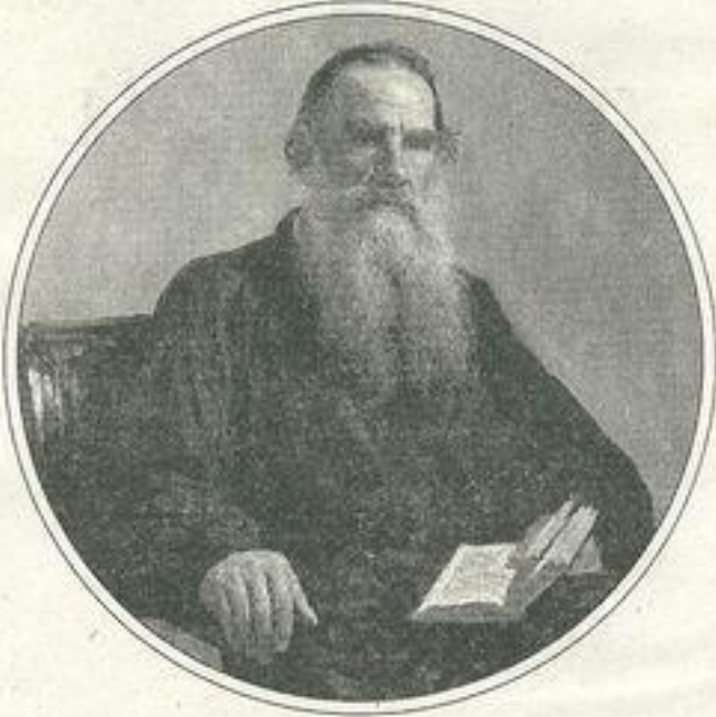
Лев Николаевич ТОЛСТОЙ