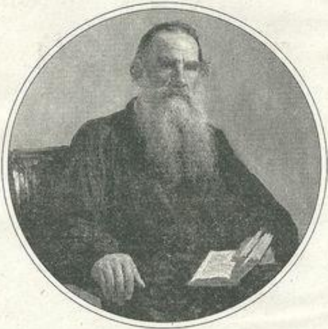
Лев Николаевич ТОЛСТОЙ