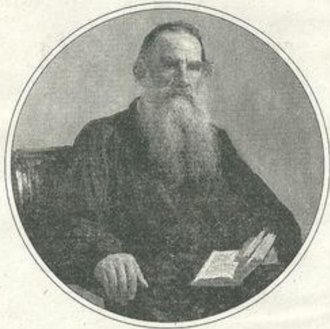
Лев Николаевич ТОЛСТОЙ