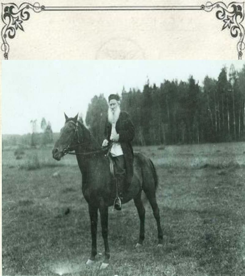
Лев Николаевич ТОЛСТОЙ