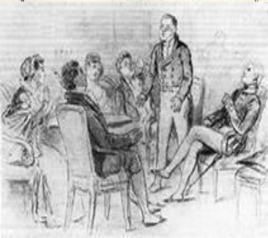
Лев Николаевич ТОЛСТОЙ (1828-1910)