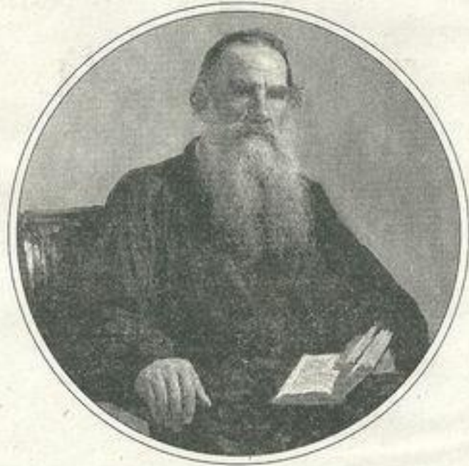
Лев Николаевич ТОЛСТОЙ