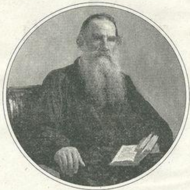
Лев Николаевич ТОЛСТОЙ