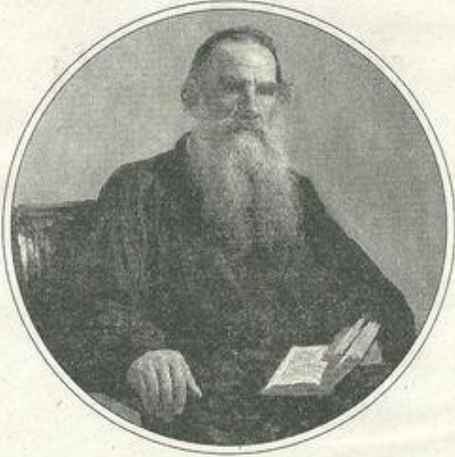
Лев Николаевич ТОЛСТОЙ