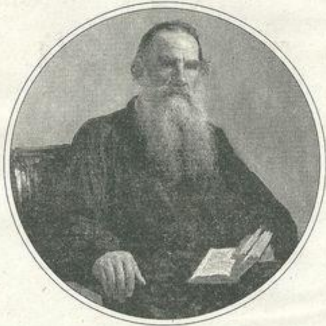
Лев Николаевич ТОЛСТОЙ (1828-1910)

Война и мир Великая сила классики заключается в способности художника отзываться своим чутким сердцем на все происходящее в мире, воплощать человеческие чувства в яркие художественные образы и, по словам Л.Толстого, заражать этим чувством СВОИХ читателей