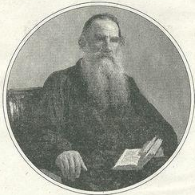
Лев Николаевич ТОЛСТОЙ