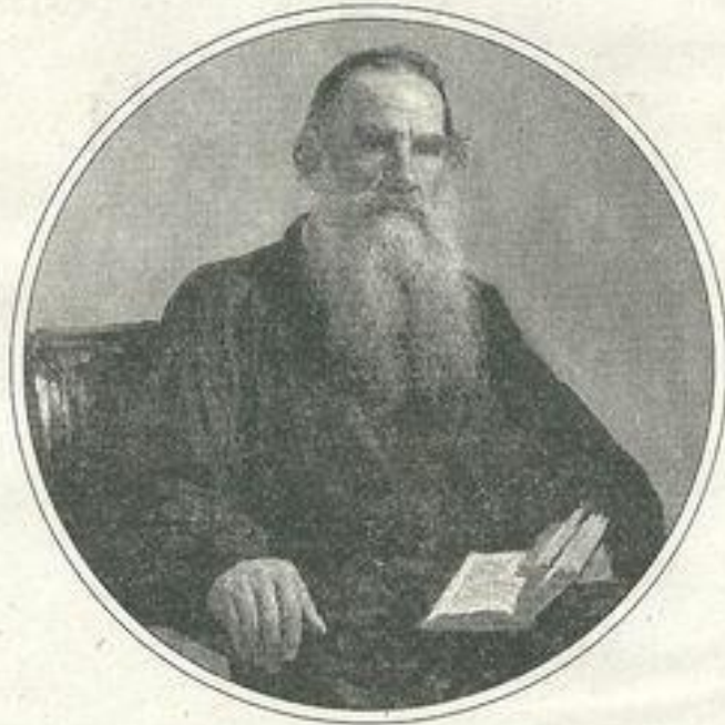
Лев Николаевич ТОЛСТОЙ

Толстой заплатил нищему и привел его в ресторан гостиницы, где ужинали богатые гости, чем вызвал откровенный протест. Иностранцы были шокированы его поведением, а русский писатель в свою очередь был поражен бесчеловечностью буржуазного общества