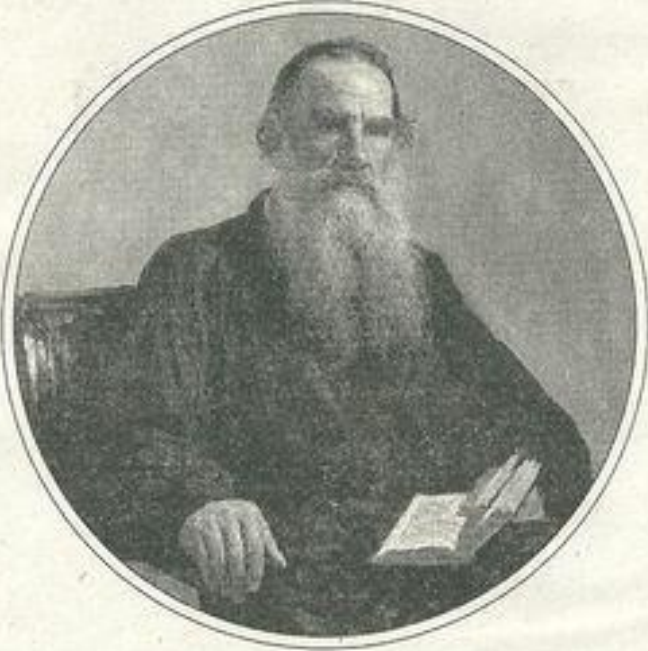
Лев Николаевич ТОЛСТОЙ