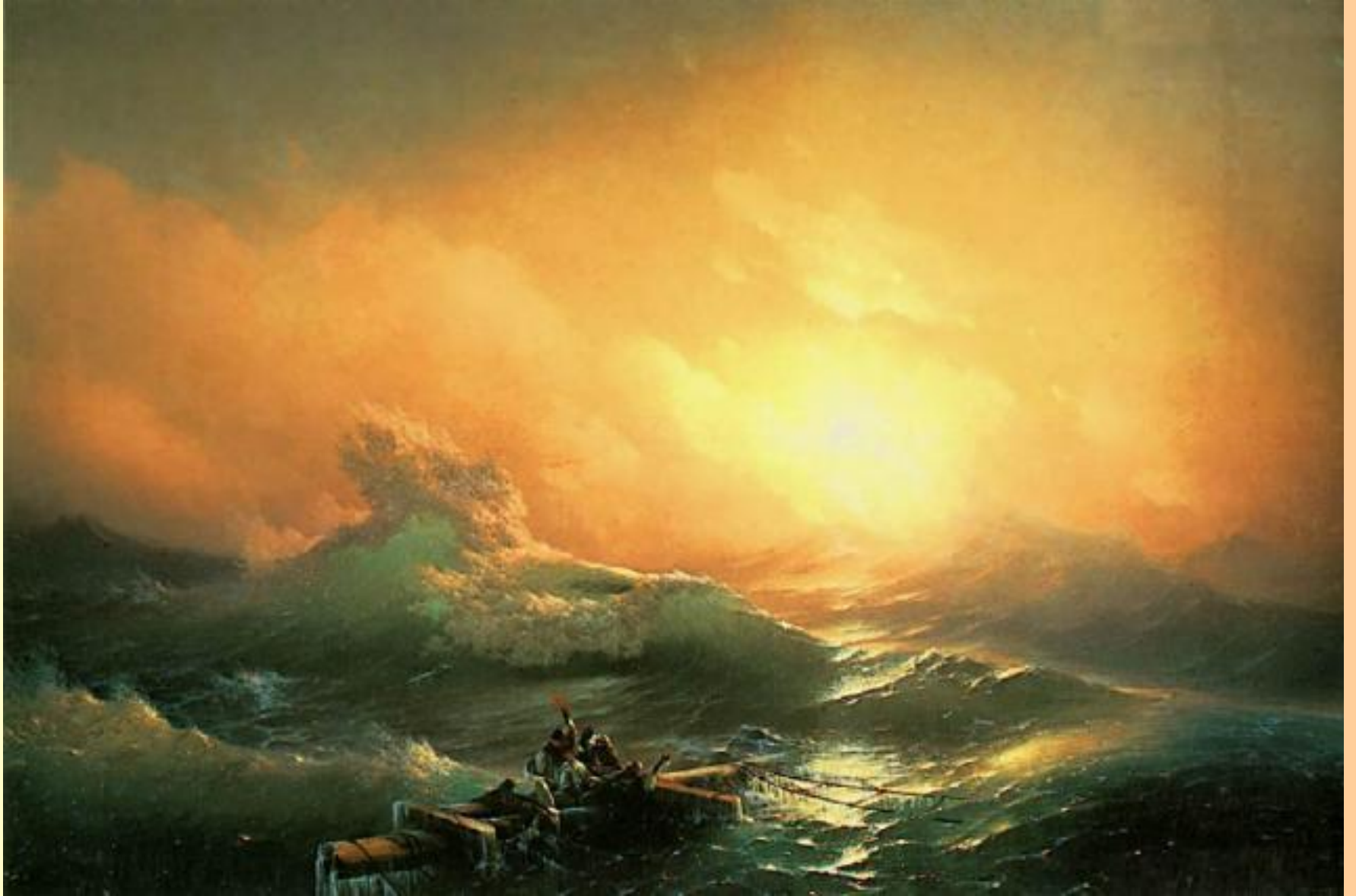
И. К. Айвазовский « Девятый вал »