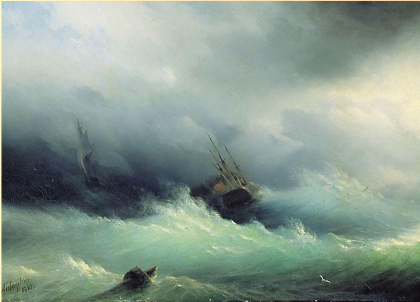
И.К. Айвазовский «Бурное море».1860