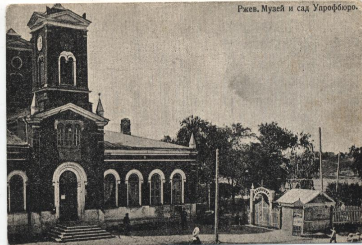
Ржев. Музей и сад Упрофбюро.