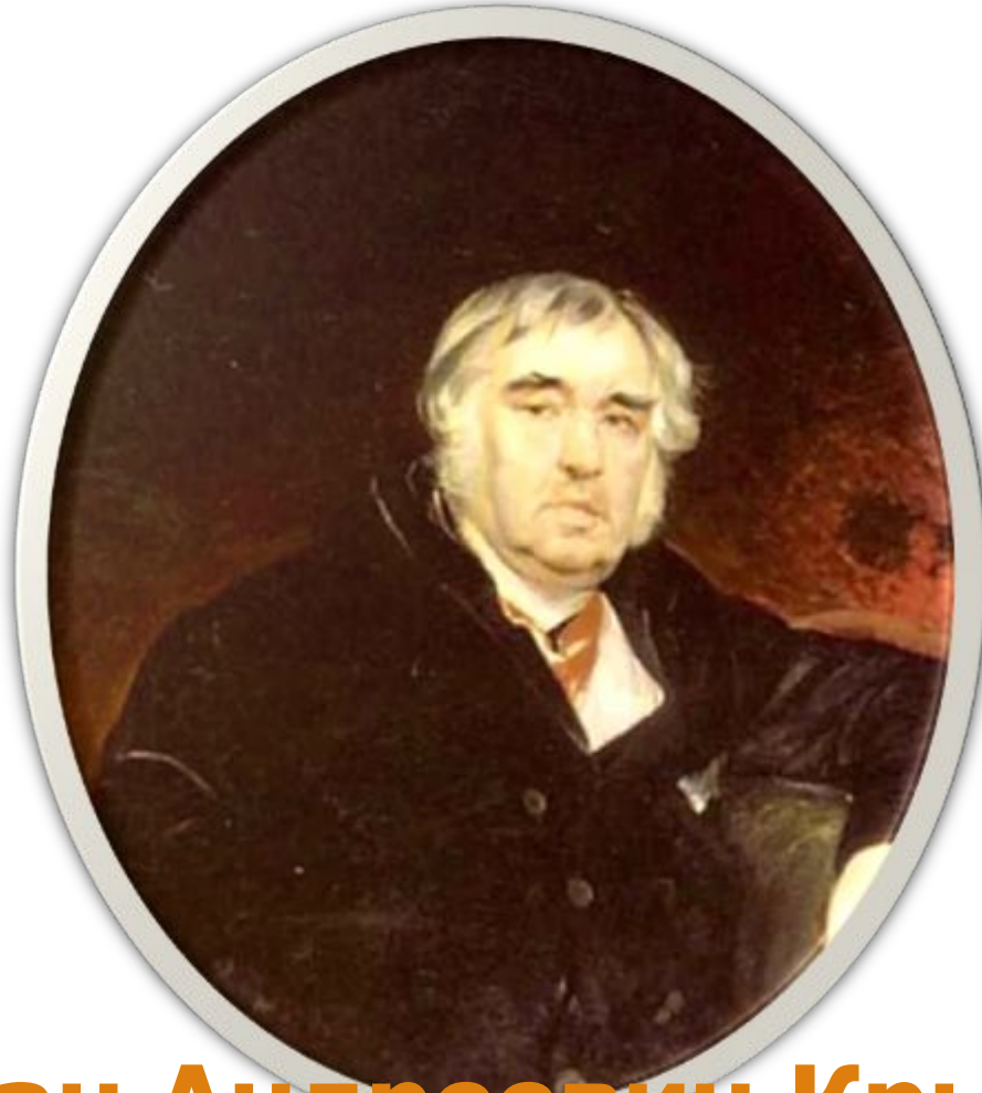
Иван Андреевич Крылов