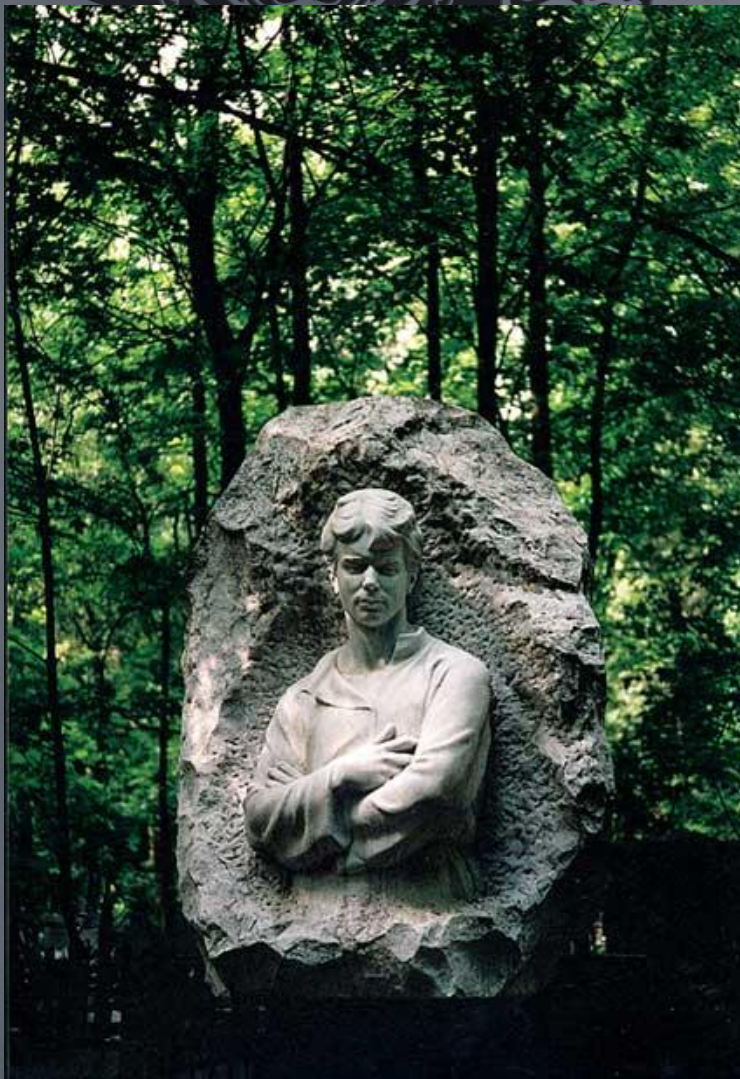
МОГИЛА С.ЕСЕНИНА НА ВАГАНЬКОВСКОМ КЛАДБИЩЕ