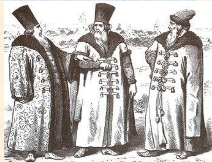
Русские бояре XVI-XVII вв.

грамотах. В начале фамилии появились у бояр и дворян, потом у горожан (Голицыны, Морозовы). Позже всех появились фамилии у крестьян, чаще всего происходили от имени: Иванов, Петров, Манькин, Марьин и т.д. «Офамиливание» русского народа длилось нескольких столетий, и в каждом регионе—особым образом.