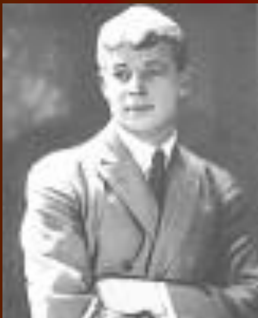
С.А. Есенин. 1922 год.