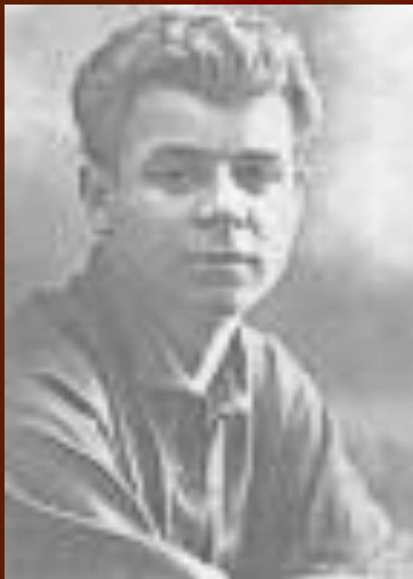
С.А. Есенин. 1924 год.