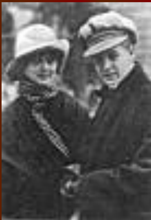
С.А. Есенин, Айседора Дункан. 1922.