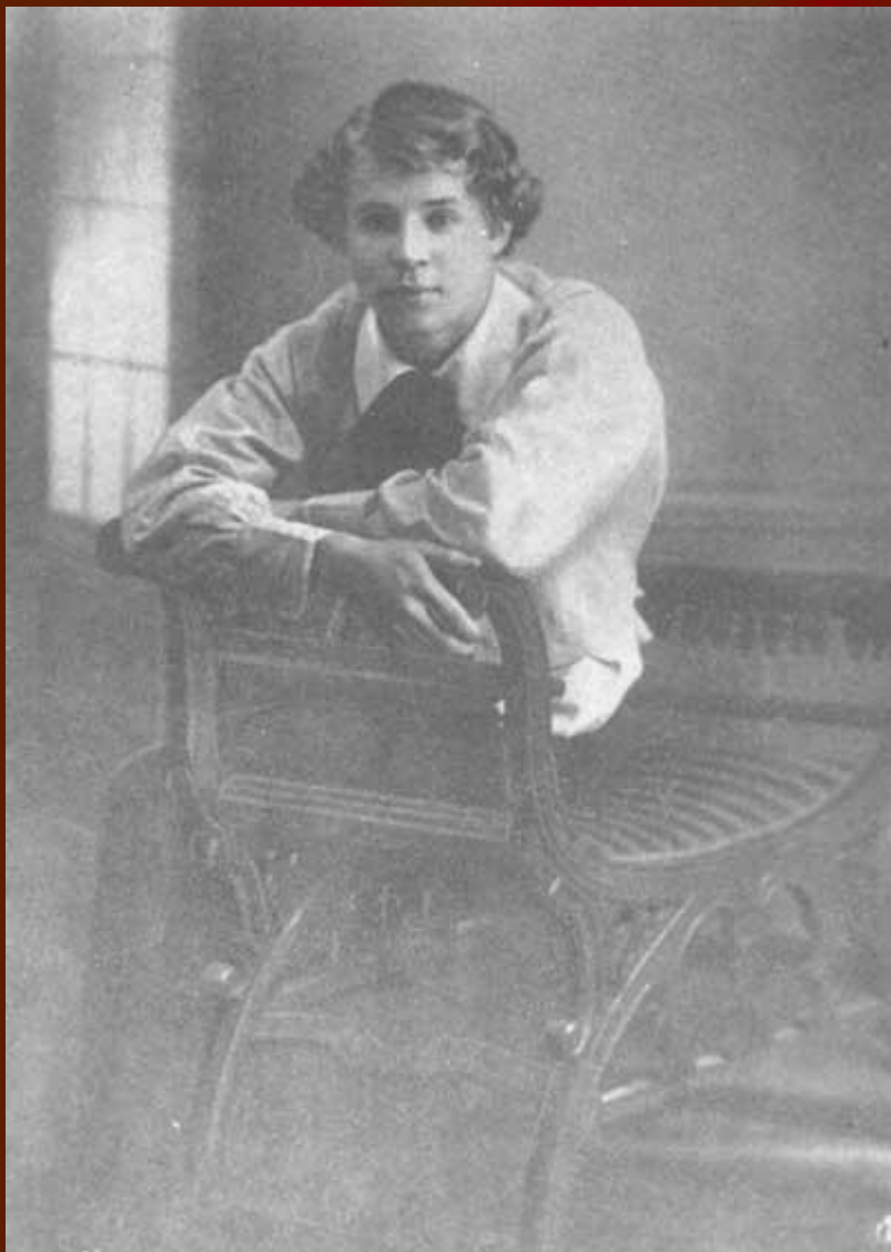
С.А. Есенин. 1914 год.