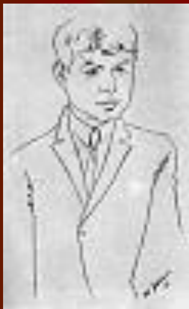
С.А. Есенин. Портрет работы Н.И. Альтмана. 1926 год.