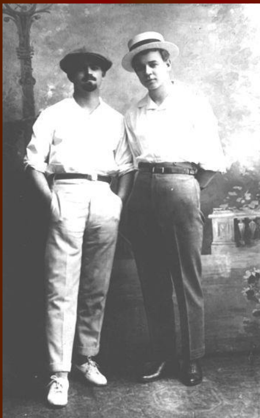
С.А. Есенин и В.И. Болдовкин. 24 мая 1925 г. Баку.