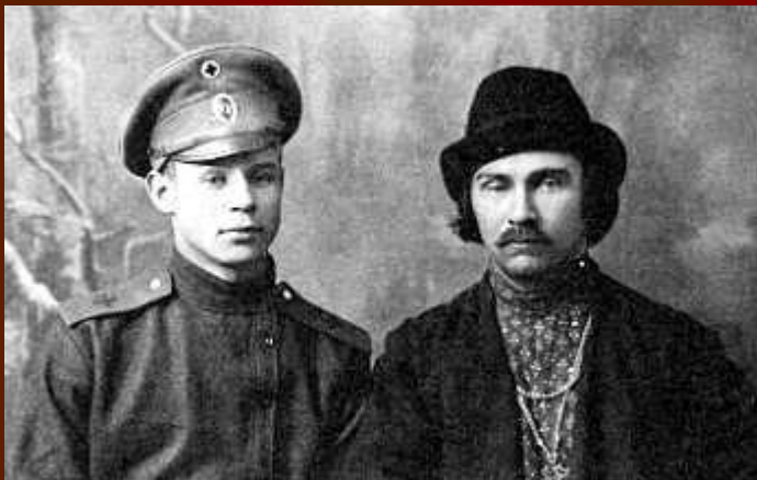
Сергей Есенин с Н. А. Клюевым. Осень 1916 г.