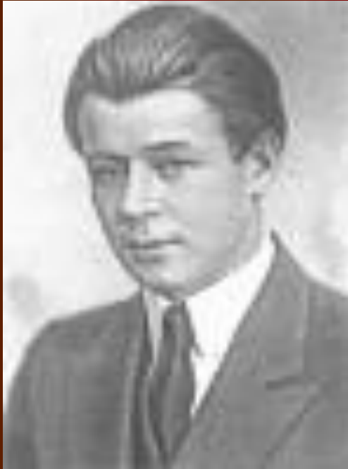
С.А. Есенин. 1924 год.