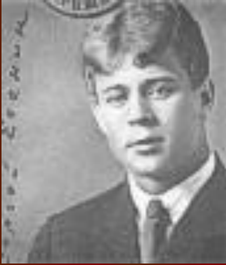
С.А. Есенин. Фотография с заграничного паспорта. 1922 год.