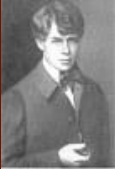
С.А. Есенин. 1919 год.