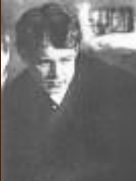
С.А. Есенин. 1923 год.