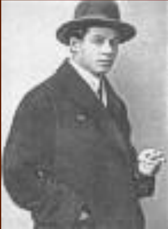
С.А. Есенин. 1925 год.