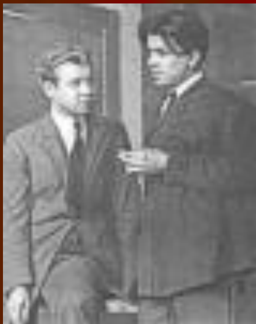
С.А. Есенин и Л.М. Леонов. 1924 год.