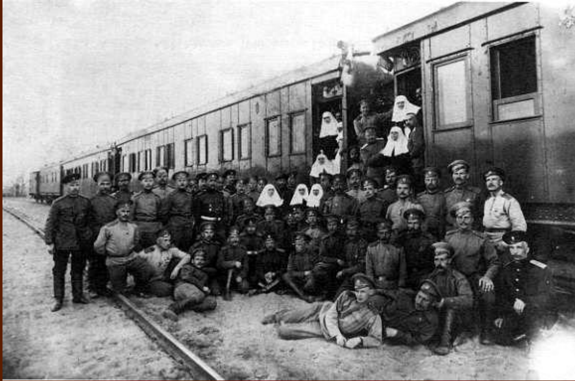
Групповой снимок персонала и команды поезда 7 июня 1916 г. на ст. Новоселицы, на границе России, Румынии и Австро-Венгрии рядом с г. Черновцы. На переднем плане фотографии - Есенин.