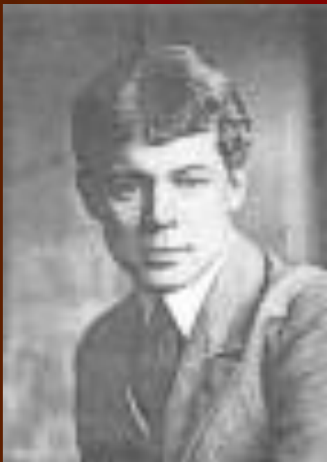
С.А. Есенин. 1923 год.