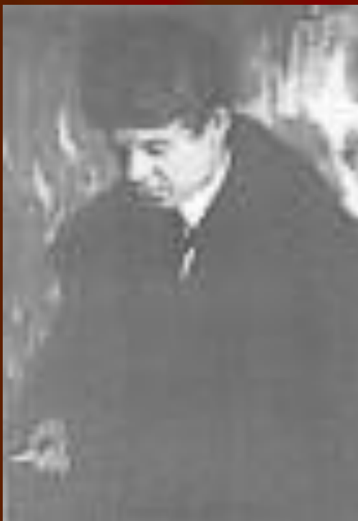
С.А. Есенин. 1922 год