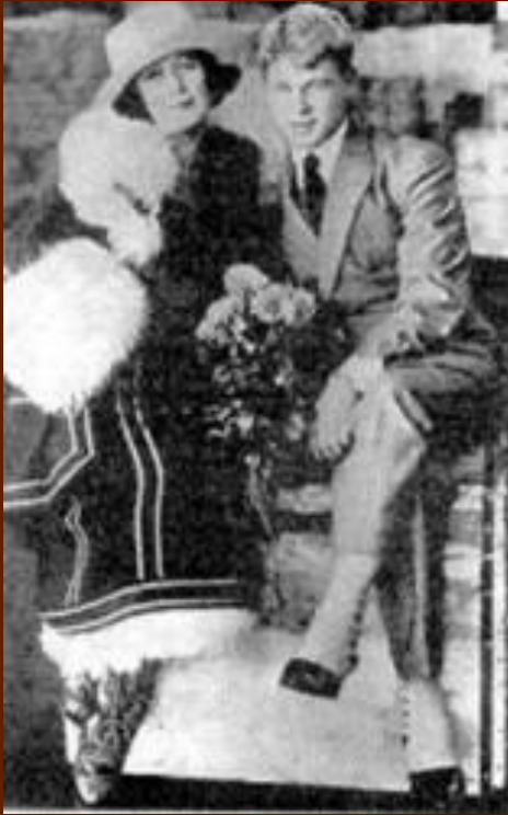
Сергей Есенин и Айседора Дункан