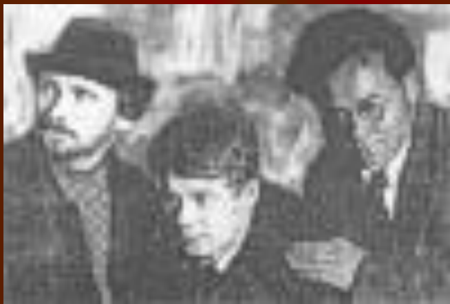
Н.А. Ключев, С.А. Есенин, Всеволод Иванов. 1924 год