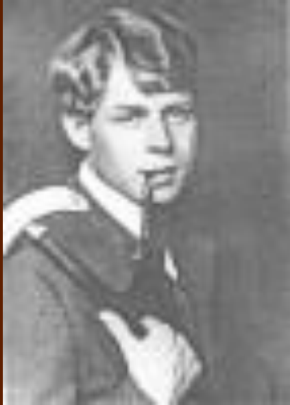
С.А. Есенин. 1919 год.