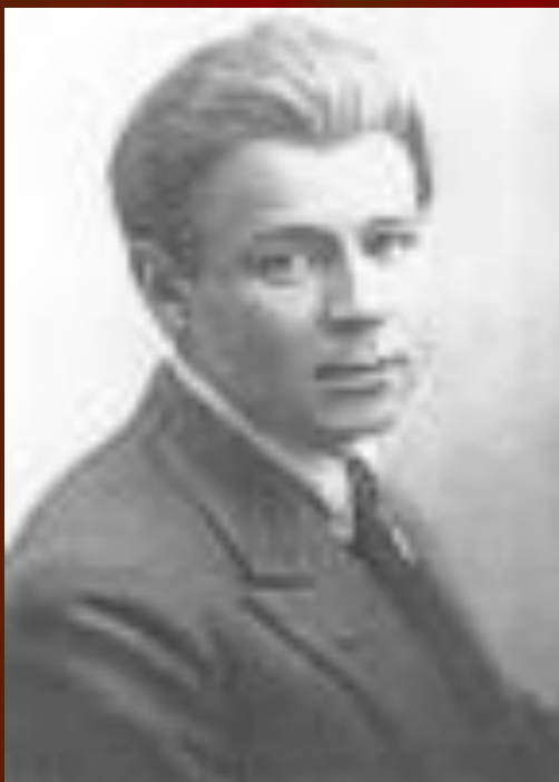
С.А. Есенин. 1925 год.