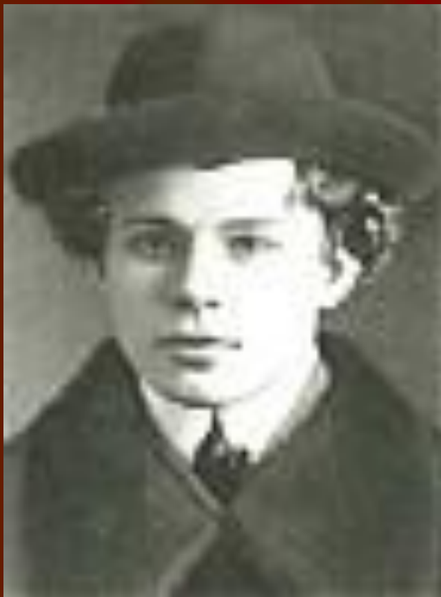
С.А. Есенин. 1913? год.