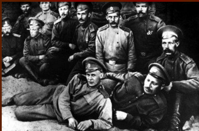
Около поезда в июне 1916 г. (Фрагмент групповой фотографии.)