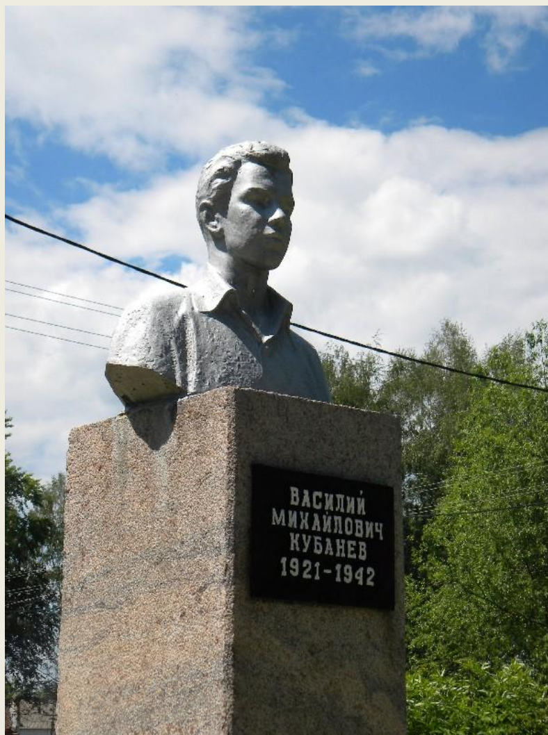
Бюст в селе Орехово Курской области Касторнинского района.