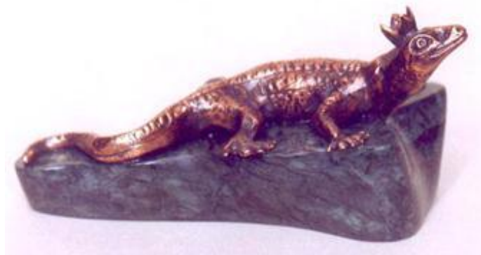
Хозяйка Медной горы, бронза. А.Н. Четвериков