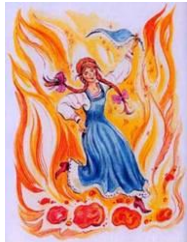
«Огневушка-поскакушка» В. Челак