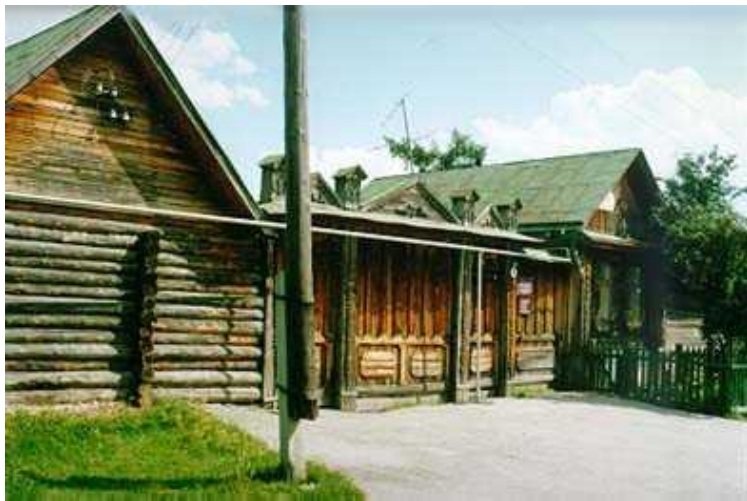
Дом Бажовых, Сысерть

«...Родился 27 января (15 по старому стилю) 1879 г. в Сысертском заводе бывшего Екатеринбургского уезда, Пермской области. Отец по сословию считался крестьянином, но работал на заводе... мать кроме домашнего хозяйства занималась рукоделием «на заказчика».