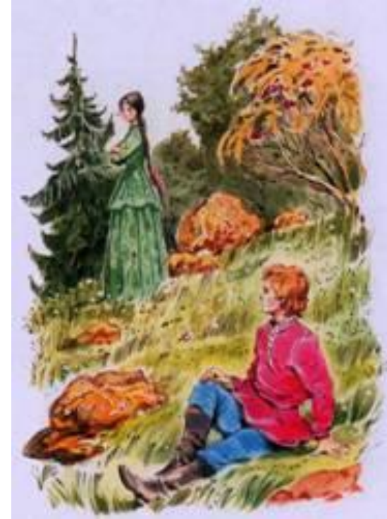
«Медной горы Хозяйка» В. Челак