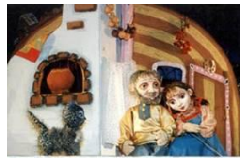
Спектакль Омского кукольного театра «Серебряное копытце»