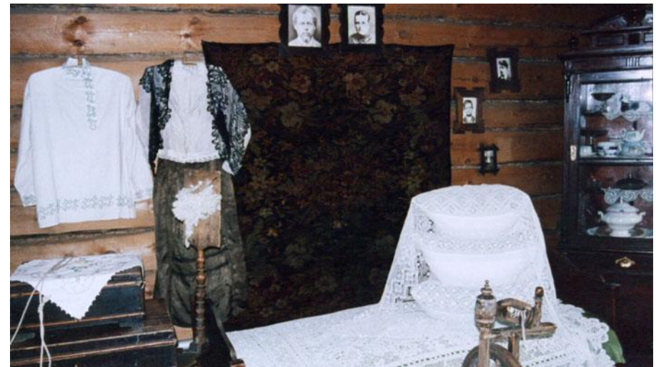
Комната в доме Бажовых, Сысерть