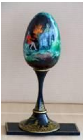
Пасхальное яйцо «Хозяйка Медной горы», дерево. В.А. Панин. Палех, 2003.

Сказы Павла Петровича Бажова так умны и так красивы, что композиторы сочиняют к ним музыку, художники рисуют иллюстрации.