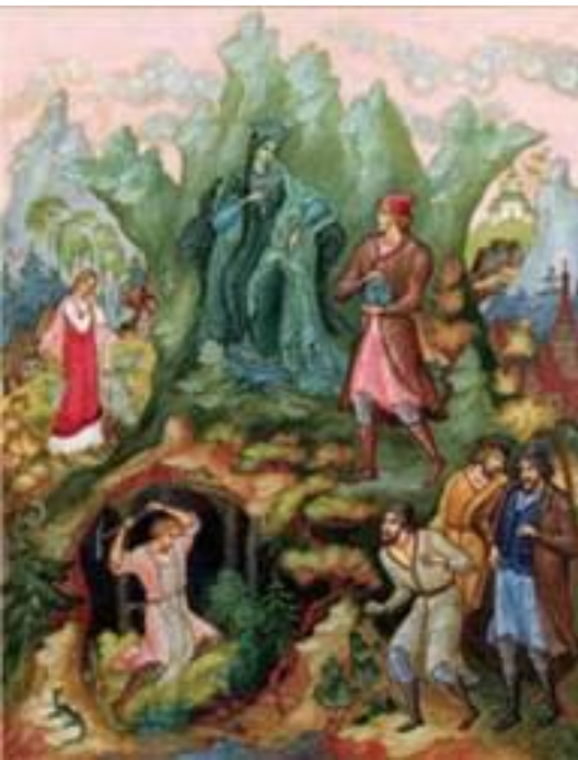
«Медной горы Хозяйка» К. Кукулиева