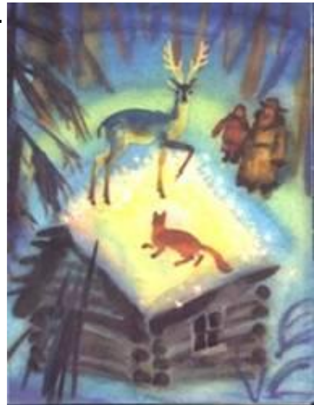
«Серебряное копытце» Г. Мосин