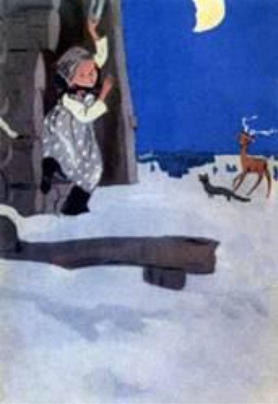
«Серебряное копытце» М. Успенская