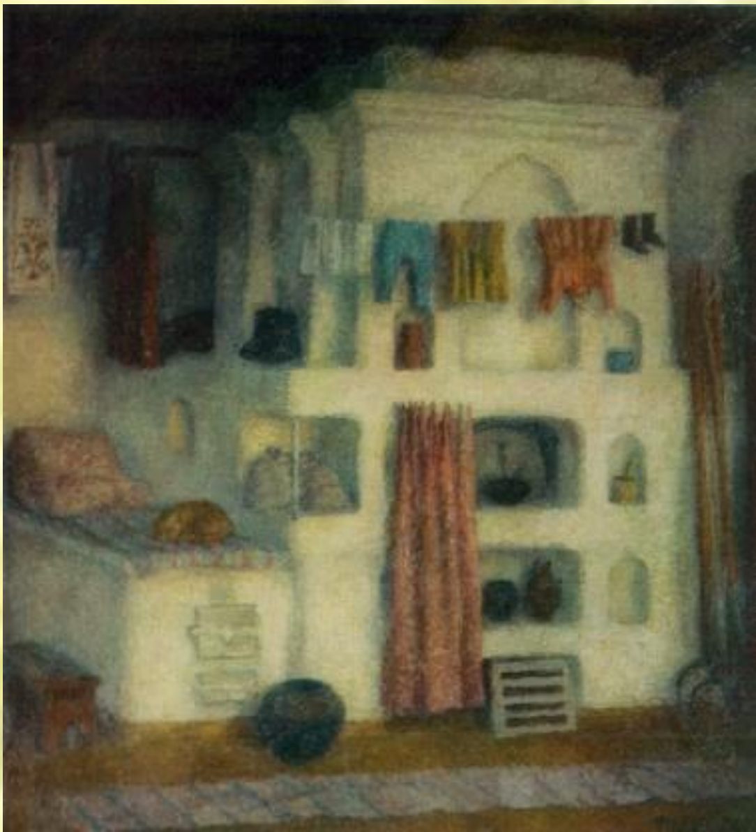
Старая теплая печь