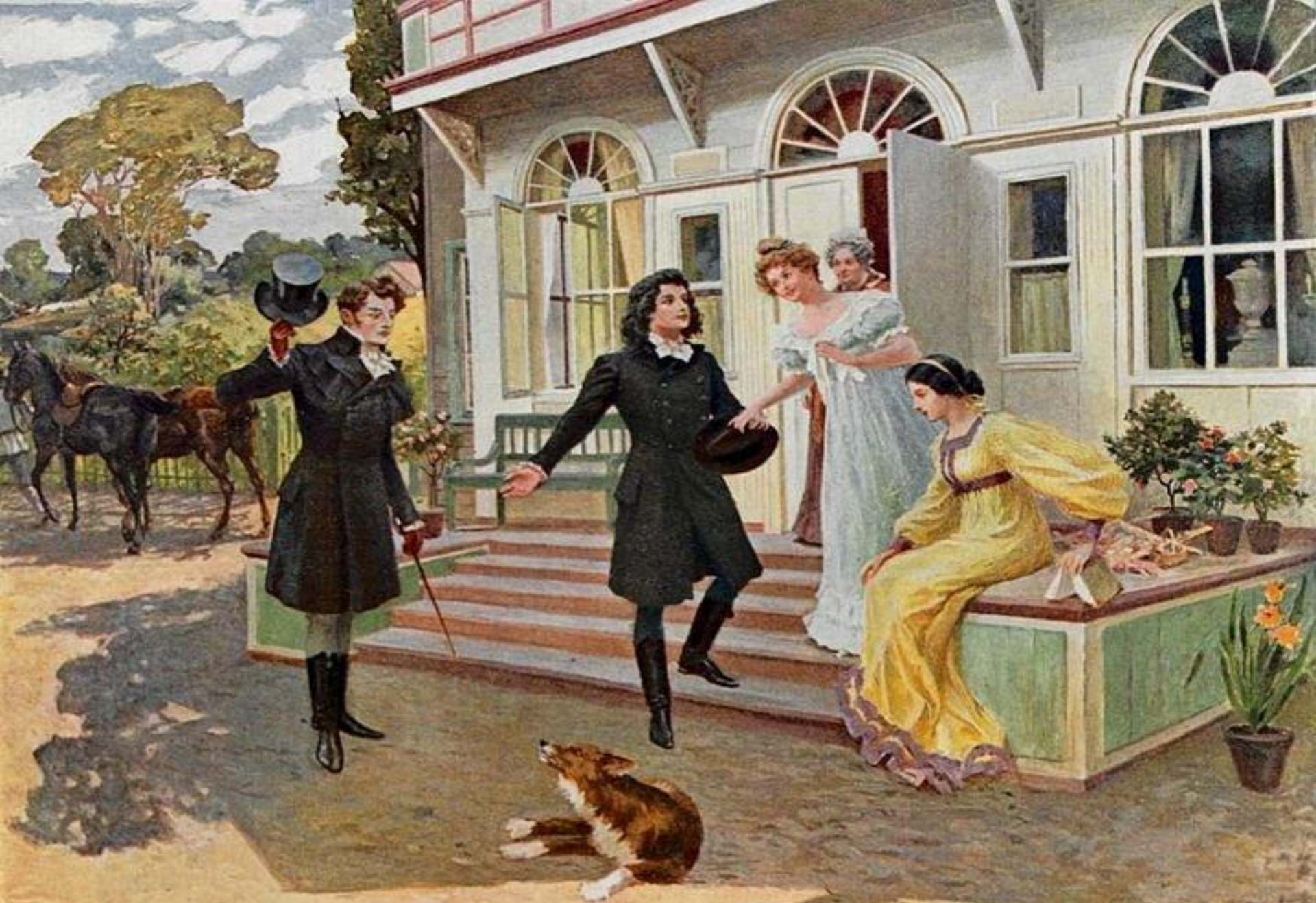
Приезд Онегина и Ленского к Лариным