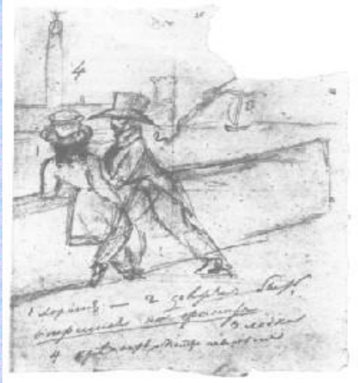
Автор и герой. Рисунок А.С. Пушкина.