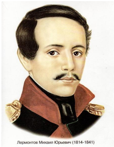
Лермонтов Михаил Юрьевич (1814-1841)

Сценарий к мультфильму «Три пальмы» по одноименному стихотворению М.Ю. Лермонтова