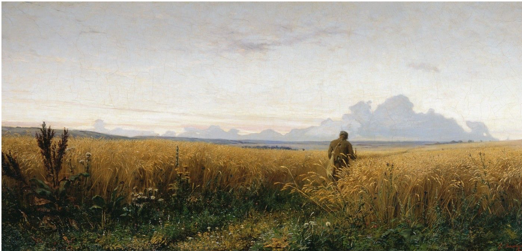
Григорий Мясоедов Дорога во ржи