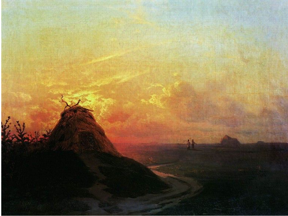
Иван Айвазовский. Сжатое поле