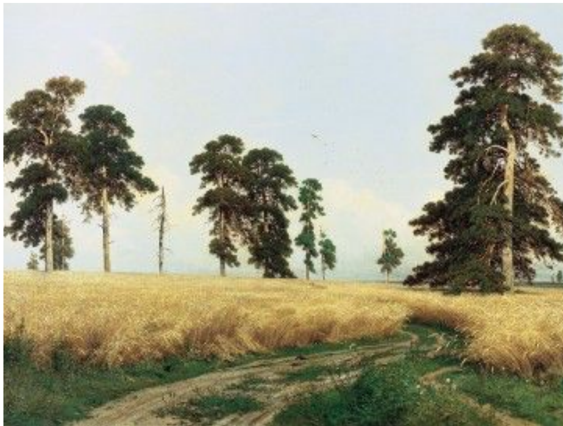
Иван Шишкин Рожь.