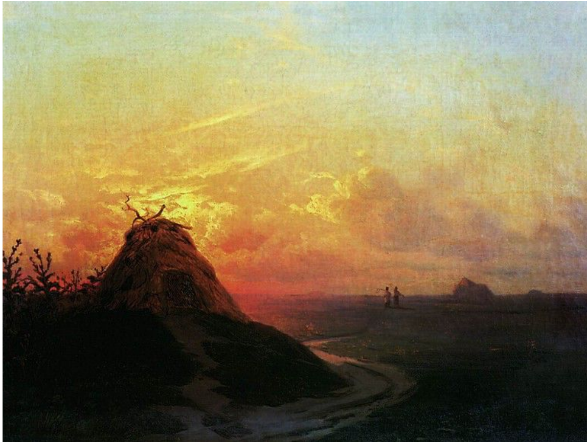
Иван Айвазовский. Сжатое поле