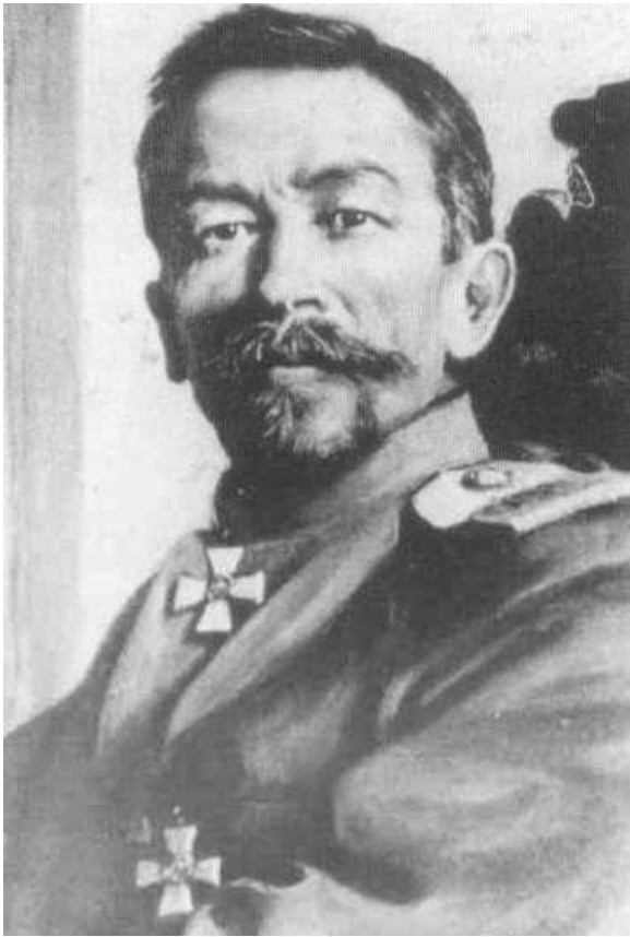
Генерал Л. Г. Корнилов