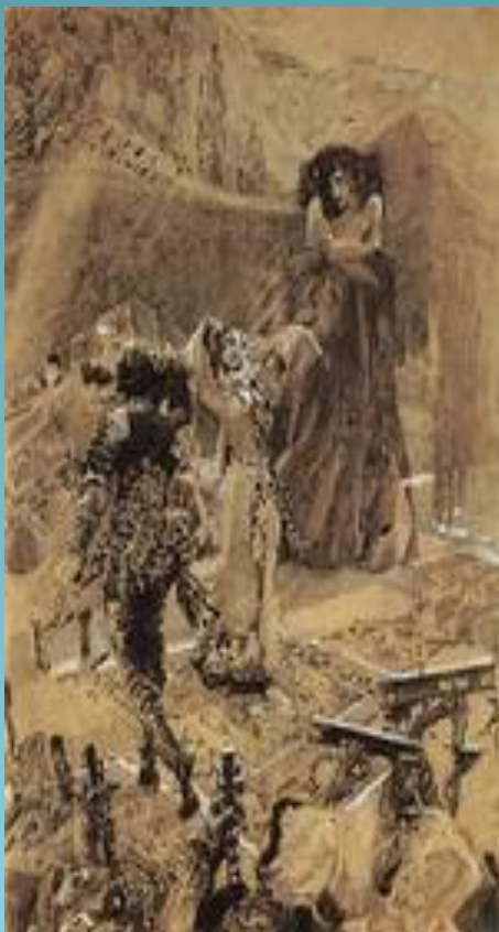
Демон, смотрящий на танец Тамары