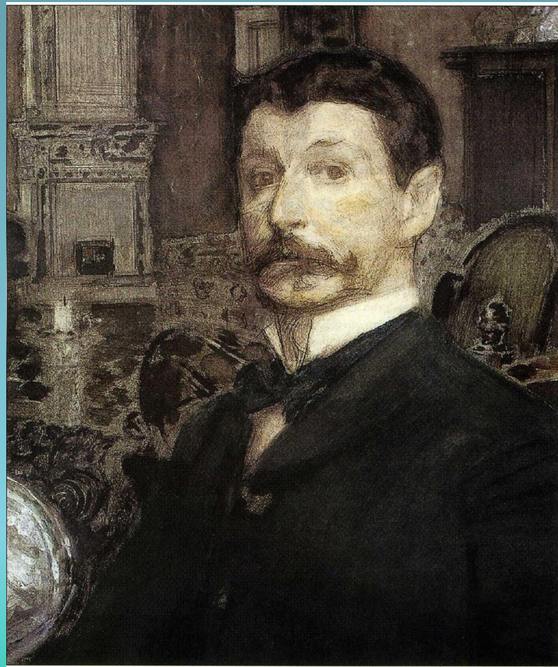
М.А.Врубель. Автопортрет с раковой

Никто из иллюстраторов Лермонтова ни до, ни после Врубеля не подошел к его творческому и философскому мирозерцанию так близко, как это удалось художнику, заколдованному «Демоном» Лермонтова и своим собственным.