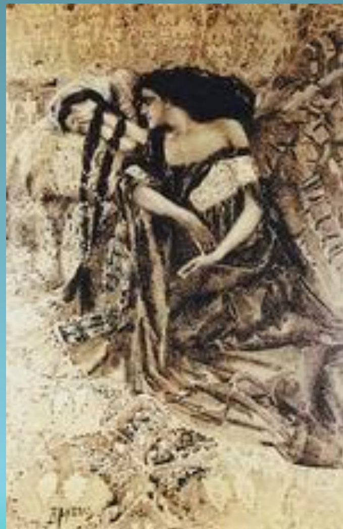
Тамара и Демон