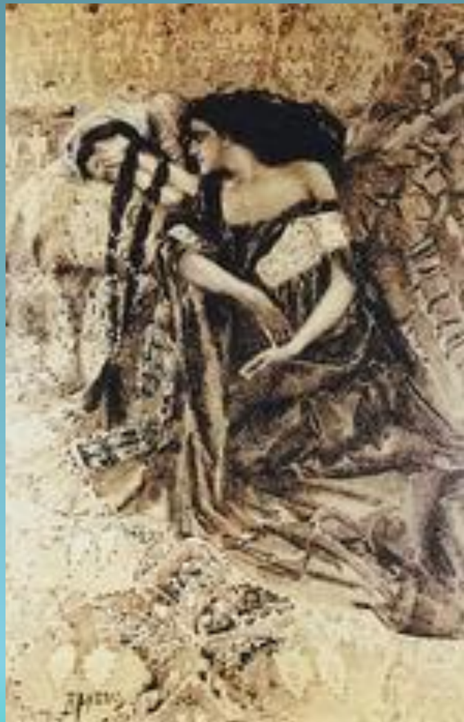
Тамара и Демон