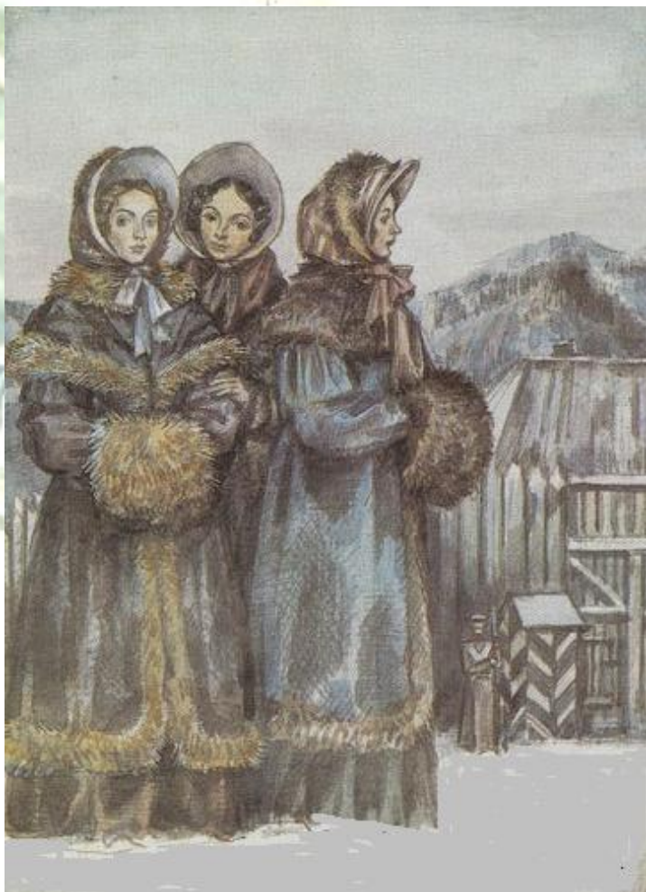
Поэма Н.А. Некрасова «Русские женщины»

Но не только крестьянки - предмет любования поэта. Все героини Некрасова - женщины самоотверженные, способные принести себя в жертву тем, кого они любят.