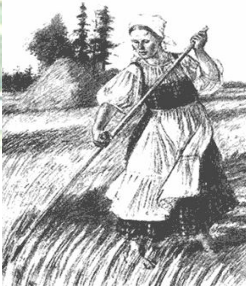
Стихотворение Н.А. Некрасова «Мороз, Красный нос»

Русская женщина предстает в стихах Некрасова не только в образе замученной работой крестьянки. Есть и другой тип – величавой славянки.