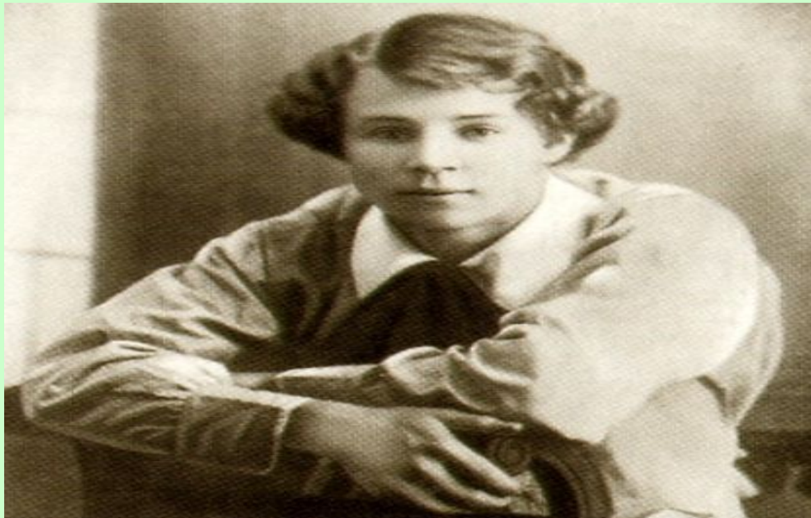
С. Есенин. 1914 г.

Семнадцати лет уехал в Москву, работал в конторе у купца, корректором в типографии; продолжая писать стихи, участвовал в Суриковском литературно-музыкальном кружке. В 1912 поступил в Народный университет А.Шанявского на историко-философское отделение, проучился полтора года.