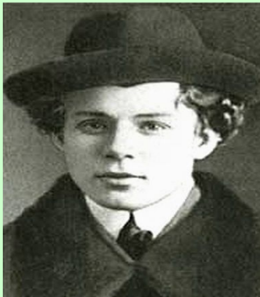
С. Есенин. 1913 г.

Учился в Константиновском земском училище, затем в Спас-Клепиковской школе, готовящей сельских учителей. После окончания школы год жил в селе.