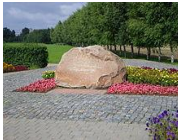
Мемориальный знак, посвящённый памяти Константина Симонова, установленный на Буйничском поле.

Много на земле стихотворений хороших и разных. Но «Жди меня» Симонова стоит особняком, поскольку затрагивает самые нежные струны человеческой души. Это произведение о любви, хотя это слово ни разу там не упоминается, но каждый, открывающий его для себя вновь и вновь, это понимает. И, как всякое великое искусство, оно делает человека лучше, чище и нравственно богаче.